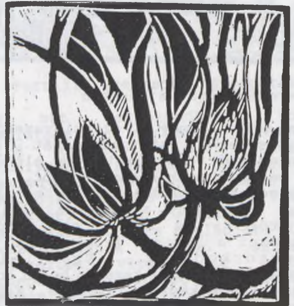
Mátyus Magdolna: Vadvirág