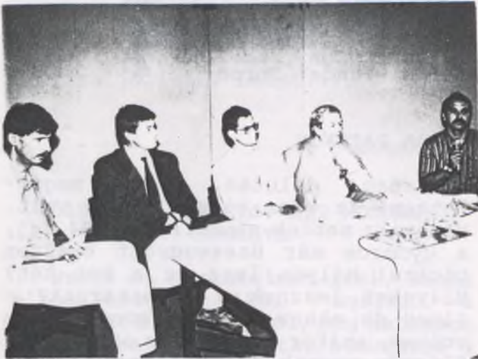
A disputa vendégei

Üdítően hatott a napjaink személyeskedéseivel, "süketek párbeszédével" tarkított politikai életében az a beszélgetés, amely "Pataki Disputa" címmel zajlott a népfőiskola rendezésében.