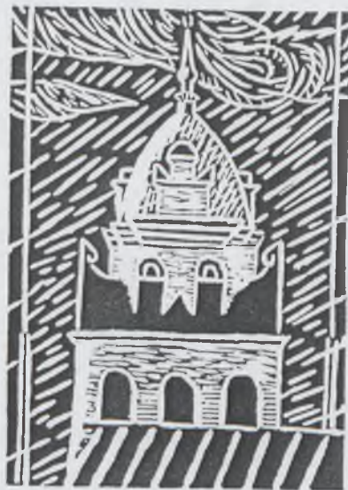
Pergel Tünde: Torony