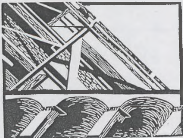
Demahidj Klára metszete