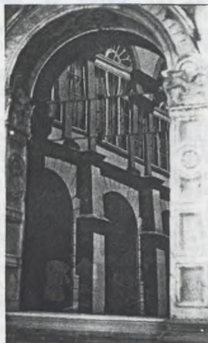
REFORMÁTUS SZEMMEL A KÉT HÉT RŐL (Értékelés a Református Szekció munkájáról)

Meglehetősen nagy izgalommal tekintettünk a nyári Népfőiskola eseményei elé. Hosszú kényszerpihenő után, hisszük, hogy az emberi jószándékon túl Isten lelke munkálta az alkalmat és adta a lehetőséget a református szekció elindulására. A felkért előadók nemcsak tárgyi tudásuk legjavát adták, hanem hitükkel is gazdagítottak bennünket. Fáradságra nem panaszkodtunk, mert a felvetett és megvitatott téma mindannyiunkat mélységesen érdekelt. A falukutatás úgy a hallgatónak, mint Vajdácská mindhárom felekezetbe