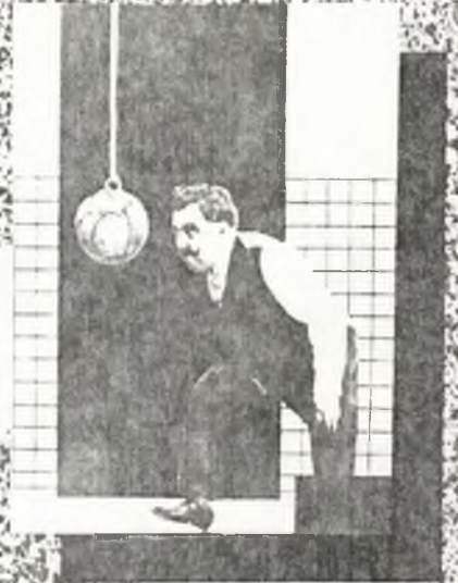
kis magyar mozdonytan