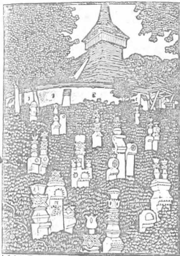
KALOTÁSZEGI • FEJPAK • 1871 KÖS KÁROLY FANET SZÉ- TE ERDÉLYBŐL.

Barátsággal köszöntöm a sárospataki népfőiskola hallgatóit, vezetőit.