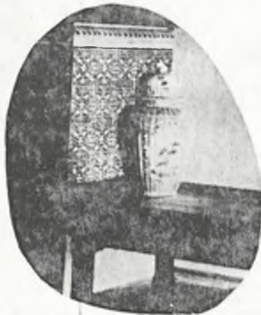
A kastély 1890-ben