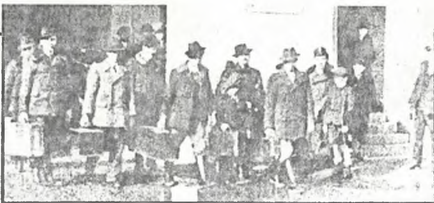
A hetedik sárospataki népfőiskolára érkező hallgatók 1943-ban

A népfőiskola gondolata csak a nyolcvanas évek elején vetődött fel ismét. Azóta — sok kudarc, félreértés, fel-feltámadó bizalmatlanság után — egymást követik az értő és felelős megmozdulások annak érdekében, hogy újra kibontakozhasson egy korszerű népfőiskolai mozgalom.