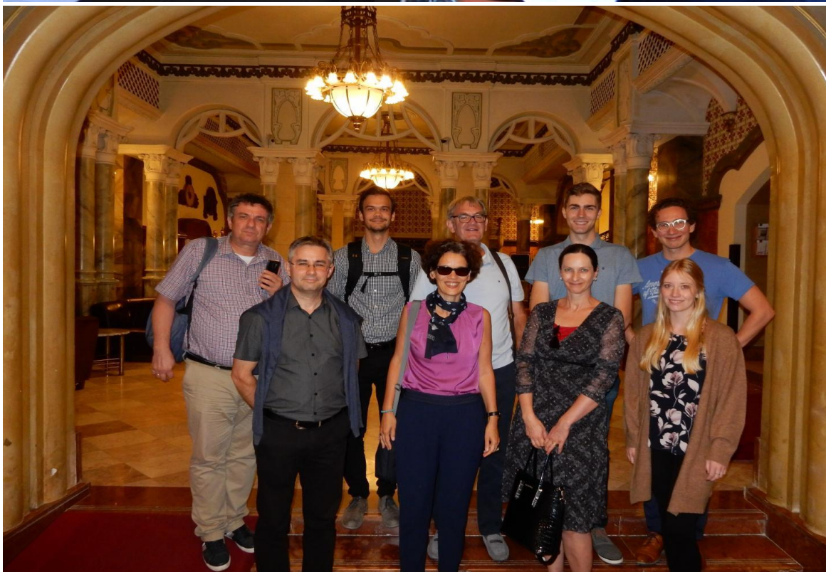
1–2. kép: Pécs, 2019. szeptember 3–4.