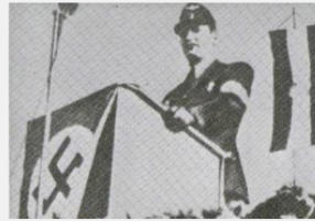
Volksgruppenführer Franz Anton Basch (1940)