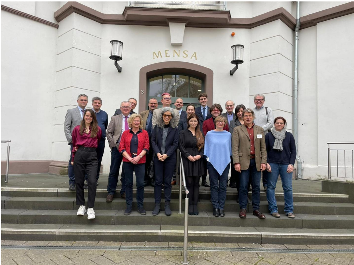
4. kép: Göttingen, 2023. március 28–29.

A projekt negyedik évében elkészült a kutatás forrásait és eredményeit bemutató német nyelvű honlap, melynek elérhetősége 2023 végére válik korlátlaná, 2023 tavaszán pedig Göttingenben rendeztük meg záró konferenciánkat.