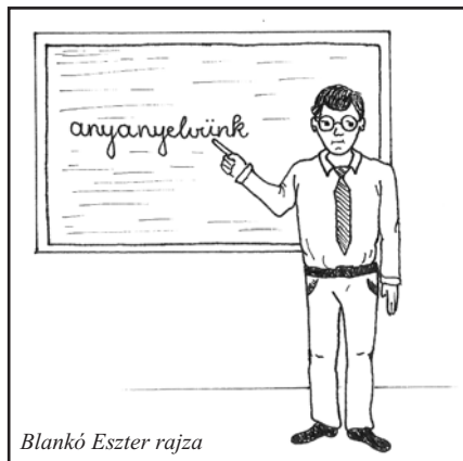
Blankó Eszter rajza