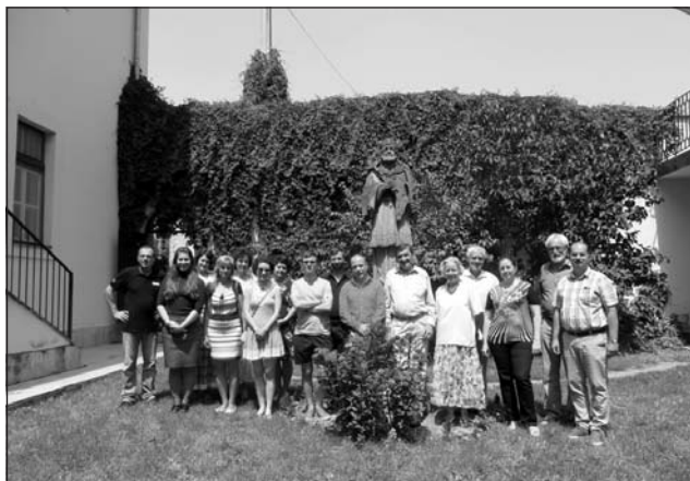
A 3. nyelvésztábor