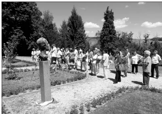
Beszélni nehéz!-körvezetők kirándulása, Csesztve