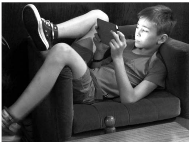
Tárgyi kötődés

Tárgyi kötődés. Az ember a leginkább tárgyalkotó és tárgyhasználó lény. „A tárgy megmunkálása során ugyanolyan fajta rekonstrukciót végez az ember, mint amikor beszél. A természetben talált tárgyat egy gondolati konstrukció, egy absztrakt séma alapján bizonyos szabályok szerint átalakítja (...) A tárgyak új konstrukciója létrehoz egy mesterséges tárgyi világot, amely éppen úgy modelleje a környezetnek, mint a nyelvi konstrukciók. A nyelvészek és a kultúrantropológusok feltételezik, hogy a nyelvhasználat és a tárgyhasználat között egyfajta izomorfia van a fentiek értelmében, és ez az emberi agy rekonstrukciós képességére vezethető vissza” (Hewest idézi Csányi 1999, 225). Ennek nyomán nagyon találonak gondolom a „tárgyi anyanyelv” kifejezést, például a kézművesség, a barkácsolás személyiségformáló erejének a hangoztatását.