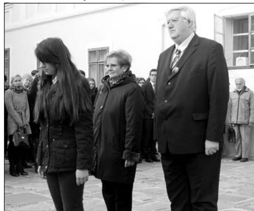
Kazinczy szobrának megkoszorúzása, Sátoraljaújhely