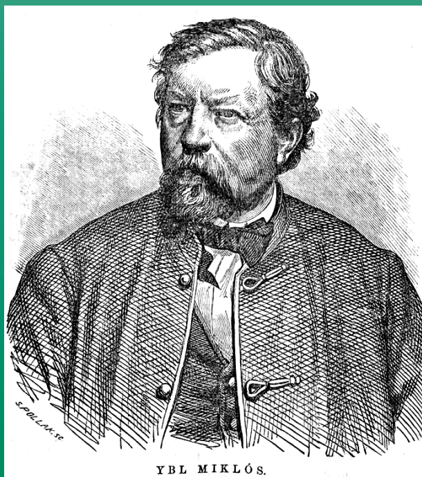
Pollák Zsigmond: Ybl Miklós (fametszet)