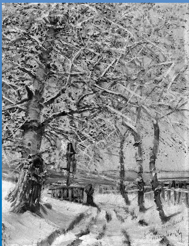
Mednyánszky László: Zúzmarás fák, 1892 körül