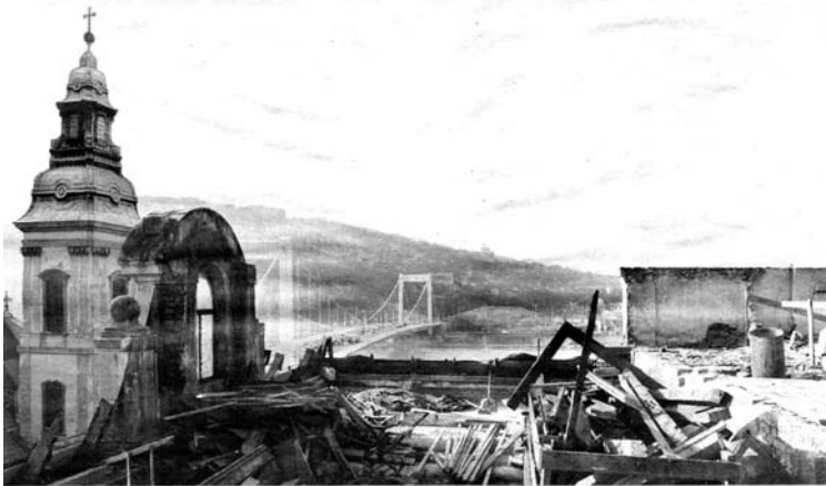
Kicsérélik az ELTE egykori bölcsészkarjának épületén a teljes tetőzetet és fűdém szerkezetet a Piarista közben. Az ingatlant folyamatosan tatarozzák, mióta az visszakerült a piarista rend tulajdonába.

Budapest Új tetőt kap az egykori bölcsészkar épülete