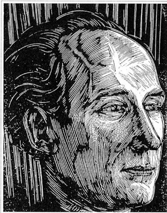
Szabó T. Attila (1906–1987)

Szabó T. Attila legnagyobb jelentőségű műve az a jelenleg XII. köteténél tartó hatalmas szótár, amely Erdélyi Magyar Szótörténeti Tár címmel mutatja be a XVI–XIX. század erdélyi magyar nyelvének szókincsét, szó- és szóalak-történetét, jelentésfejlődését. Ennek anyagát a szerkesztő levéltári forrásokból (periratokból, levelekből, egyéb kéziratokból) gyűjtötte össze, ezért példamondatai a kor beszélt nyelvét tükrözik, s az egykori életet a maga teljességében tárják az értő olvasó elé. Ennélfogva a Tár nemcsak a nyelvtörténészeknek vált nélkülözhetetlen munkaeszközzé, hanem a társadalom- és művelődéstörténet, a néprajz, az irodalomtörténet és a névtan kutatóinak is. A nem magyar ajkú kutatók munkáját segíti az a többlet, hogy a szótár az értelmezéseket nemcsak magyarul, hanem német és román nyelven is közli. Az I. kötet 1975-ben látott napvilágot (Szabó T. Attila ekkor lépett hetvenedik életévébe). Az utolsó olyan kötet, amely még a szerkesztő életében jelent meg, a IV. volt, 1984-ben (ez egyébként, ominózus módon, a házsongárdi szócikkkel végződik). A szótár kiadása a szerkesztő halála és az akkori romániai viszonyok miatt évekre abbamaradt, s csak 1993-tól jelenhettek meg az újabb kötetek, immár Budapesten,