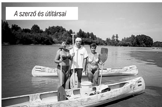
A szerző és útítársai

Az éjszakáink valóban hangosak. Sokan nehezen viselik, hogy a Tisza-parti kempingekben olykor egész éjjel szól a zene, pajtadiszkó, búfédisdiskó, kocsmadiszkó formájában. Sajnos a kultúrát ma már leginkább decibelben mérik, s örökös a perpatvar a csendért, a jó levegőért, a túra örömeért kirándulók, meg a bulizósok között.