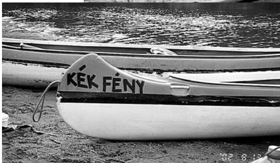
Így is lehet a Kék fényben szerepelni...

Több Tisza-túra után úgy látom, hogy a végeredmény mindkét csoport esetében többnyire az, hogy föladják. A túrázók elmaradnak, mert éjjel nem tudnak pihenni, a bulizósok kiszállnak, mert napal nem tudnak evezni. Valami józan közéletet kellene találni. A friss levegő, az evezés hatására én – csodák csodájára – mindig alszom, de minden átfordulásnál emlékszem az éppen aktuális slágerre. Tavaly a „Szerelemről szó sem volt...”, idén a „Királylány” volt a menő.