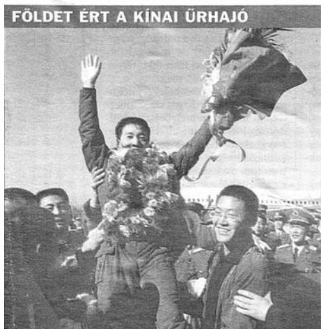
FÖLDET ÉRT A KÍNAI ŰRHAJÓ Jang Li-vej-t ünnepelték a visszatérés után. Huszonegy órnyi repülés után csütörtökön földet ért. Belső-Mongóliában az első embert szállító kínai űrhaajó, a Sencsou-5.