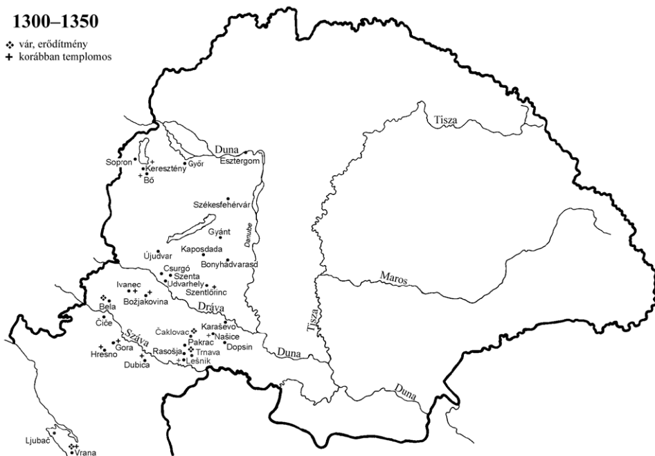
Johannita preceptoriumok a templomos javak átvétele után