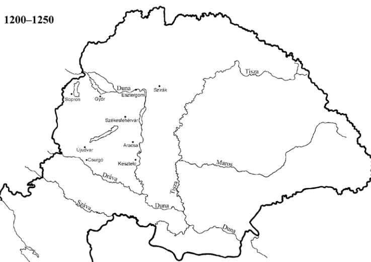
Johannita preceptoriumok a 13. század első felében

A látványos prosperitás után, IV. Béla uralkodásával nehéz évek köszöntöttek a johannitákra. Béla birtokrestaurációs politikáját már hercegeként elkezdte, majd koronás főként tovább folytatta. A források tanúsága szerint Szent János testvérei panaszt nyújtottak be a pápához, azal érvelve, hogy a magyar király még olyan birtokokat is elkobzott, melyeket világi magánszemélyektől kaptak. IX. Gergely már 1236 januárjában intette a királyt, hogy ne zaklassa a lovagokat, és egy vizsgálóbizottságot jelölt ki, hogy a lefoglalt birtokok mihamarabb visszakerüljenek a johanniták használatába. 194 Sovány vigasz volt a lovagok számára, hogy az uralkodó megszorító intézkedései nem ellenük irányultak, hanem általános érvénnyel bírtak. Akár a korábbi dinasztikus hagyományhoz való visszatérés, akár a szigorú feddés térítette el szándékaitól Bélát, annyi bizonyos, hogy 1238-tól szinte bünbánóan nagylelkű lett a Rend irányában: visszaszolgáltatta az elkobzott javakat, sőt, komoly adományokkal gazdagította a johannitákat. Részben az új adományok révén, a birtoktérképen megjelentek Dráván túli, valkói, pozsegei és Varasd megyei membrumok is.