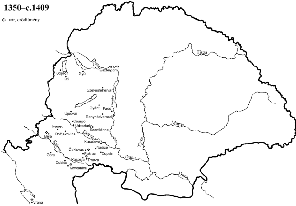
Johannita preceptoriumok a 15. század elejéig

Nemcsak a rendi vezetés vagy a tartomány viszályaira van számottevően több adatunk a 14. századból, hanem az egyes adminisztratív egységekre és azok átszervezésére is. Szembetűnő, hogy a korábban átvett templomos preceptoriumok eltűntek a század végére, birtokait vélhetően az eredendően is johannita preceptorok kezelték, illetve egy részük camera prioralisként a magyar–szlávón (vránai) perjel bevételeit gyarapította. 318 Az átszervezések során a 14. század második felében néhány új, rövid életű preceptorium tűnt fel (Moštanica és Fadd), amelyek eredendően a Rend birtokai voltak, s egy időre önállósodtak. Ezekkel együtt az Anjou-kor végén, illetve a Zsigmond-kor első felében nagyjából két tucat preceptoriummal számolhatunk a Magyar–Szlávón tartományban. A legjelentősebb és