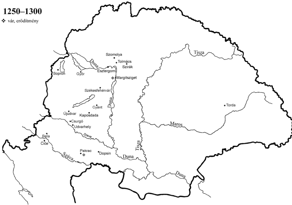
Johannita preceptoriumok a 13. század második felében

A térképre tekintve szembevetendő, hogy a preceptoriumok száma tovább nőtt, s ez legalább két tényezővel magyarázható. Egyrészt a tartomány vezetése átszervezte a már meglévő egységek igazgatását, továbbra is a költséghatékonyabb működést célozva. Az 1244-es gázai veszteség után a lovagrendek, köztük a johanniták, nagyon nagy erőfeszítéseket tettek, hogy a szentföldi veszteségeket pótolni tudják. 218 Másrészt idevág egy módszertani tanulság. A 13. század közepétől növekvő számú magánjogi (hiteleshelyi) oklevél egyre több birtokra, egyházi intézményre vonatkozóan rögzített adatokat, 219 ami némileg torzíthatja az optikánkat: a forrásokban