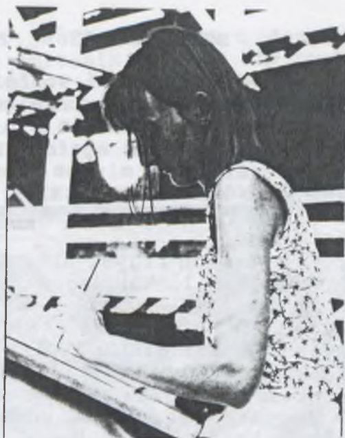
A BOL-VÁR LEGENDÁJA