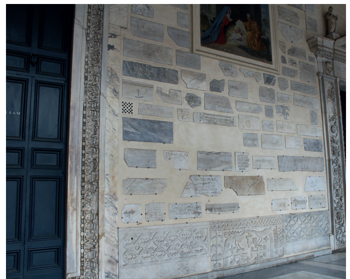
1. kép: A Santa Maria in Trastevere bazilika előtere, Róma, 2015.