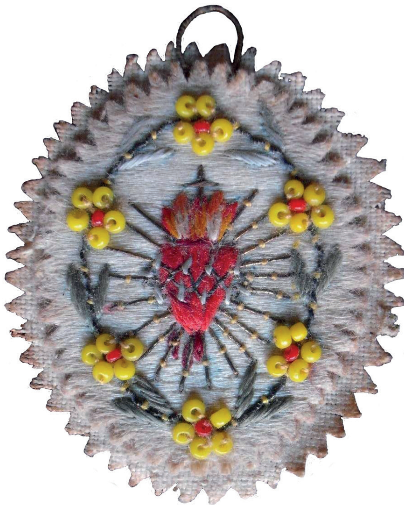
2. kép: Hímzett Jézus Szíve nyakék, 20. század eleje. A szerző tulajdona.