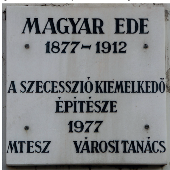
5. kép: A Magyar Ede emléktábla, Szeged, 2017. Az MTESZ és az egykori Városi Tanács közös avatásaira a minimalista stílus volt jellemző, viszonylag sok szöveges információval.