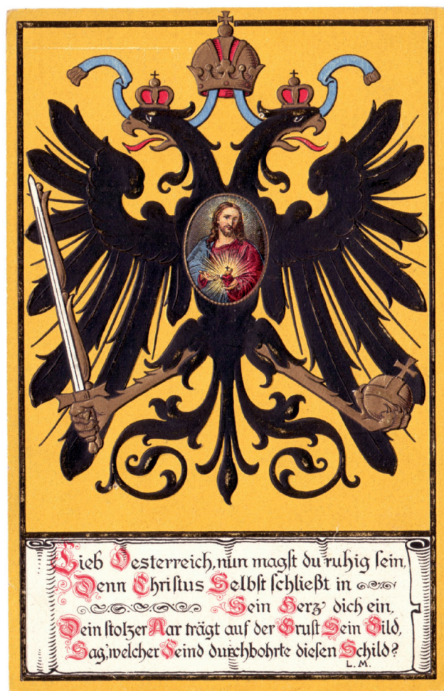
4. kép: Első világháborús propaganda képeslap, é.n. Josef Müller, München.