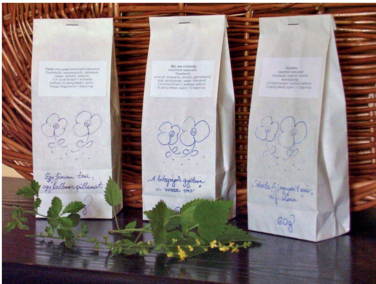
3. kép: Teák a készítő üzeneteivel. Szeged, 2015.