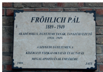
2. kép: A Fröhlich Pál emléktábla, Szeged, 2017.

Jól látható, hogy a passzív emléktáblák is jelentős információátadók, hiszen megjelenhet rajtuk az elsődleges és a másodlagos szöveges információ. Előbbi rendszerint a tábla által megjelölt téma (pl.: „Fröhlich Pál” vagy „A 200 éves szegedi nyomdászati emlékére”, 2–3. kép.). Míg a másodlagos a témához kapcsolódó további adalék (itt élt, itt született, kik állították a táblát). Közvetítő lehet továbbá a tábla anyaga, elhelyezése. Lényeges, hogy milyen magasra helyezik, illetve milyen fizikai paraméterekkel rendelkezik. Egy túl magasra vagy túl alacsonyan elhelyezett emléktábla nem fogja vonzani a tekintetet, tehát nem tölti be