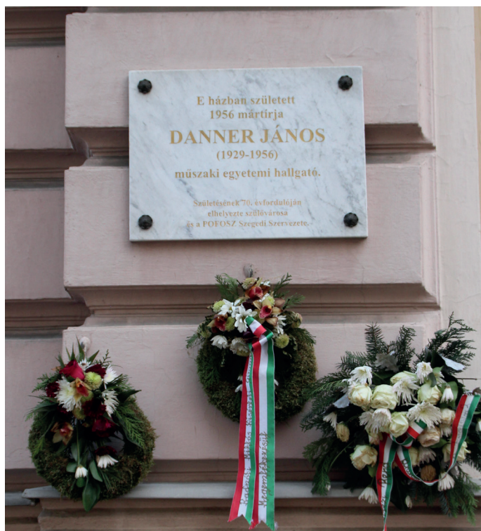
4. kép: A Danner János emléktábla, Szeged, 2017.

megemlékezések céljával avatták. Meg kell jegyezni, hogy ez a szándék idővel változhat, és természetesen a koszorútartó utólag is elhelyezhető. Az emlékhelyek, így az emléktáblák karbantartása, állagmegóvása vagy éppen ezek hiánya is szimbolizálhatja a közösség értékfelfogását. Egy 1969-es újságcikk például a méltatlanul koszos dóm téri emlékhelyek részben megoldódott problémájáról ír (Délmagyarország 1969: 4) vagy említhetnék a Hild József-díj emléktáblát egykor ellepő firkák problémáját is (Tóth 2010).