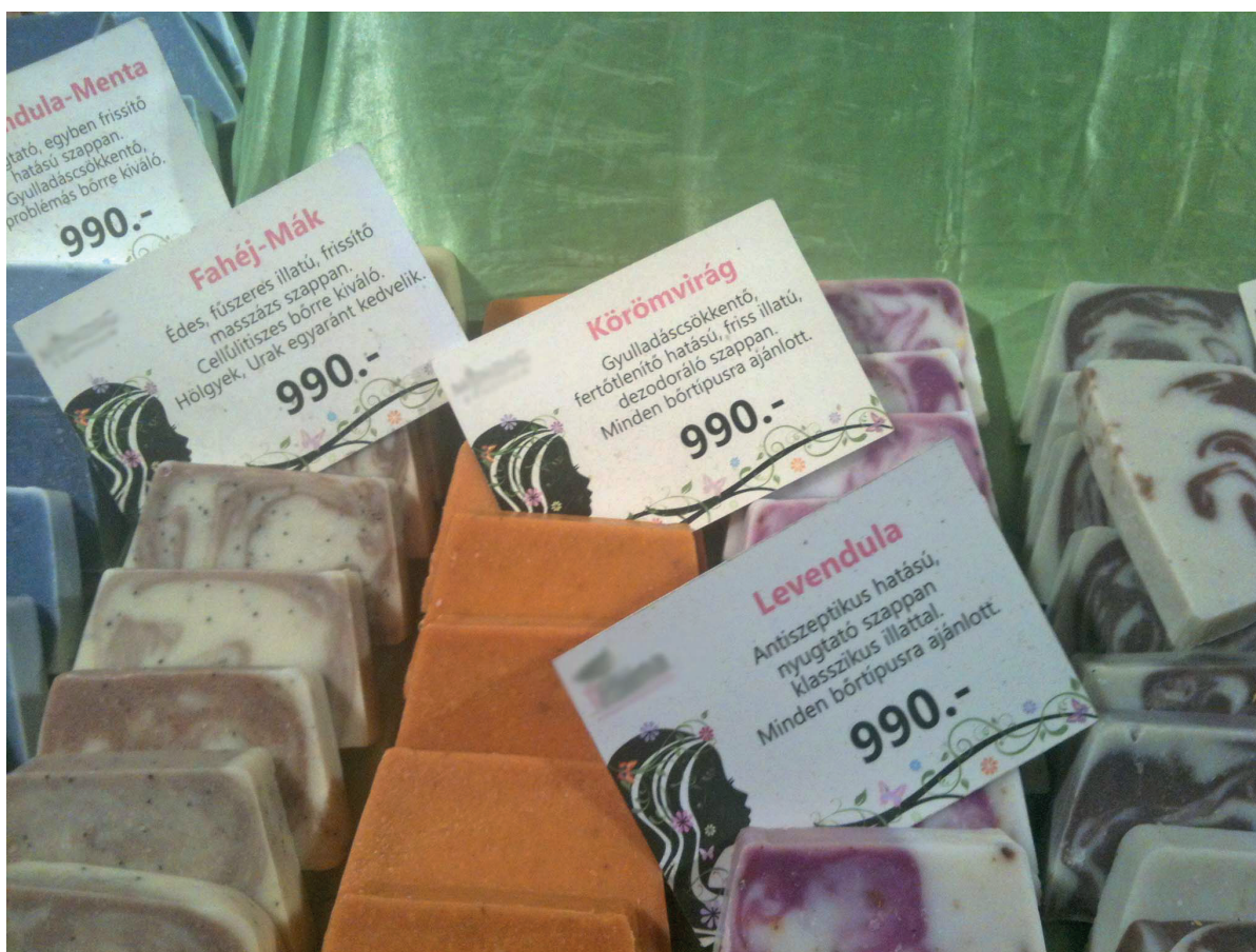
4. kép: Szappanok a kirakodóvásáron. Szeged, 2016.