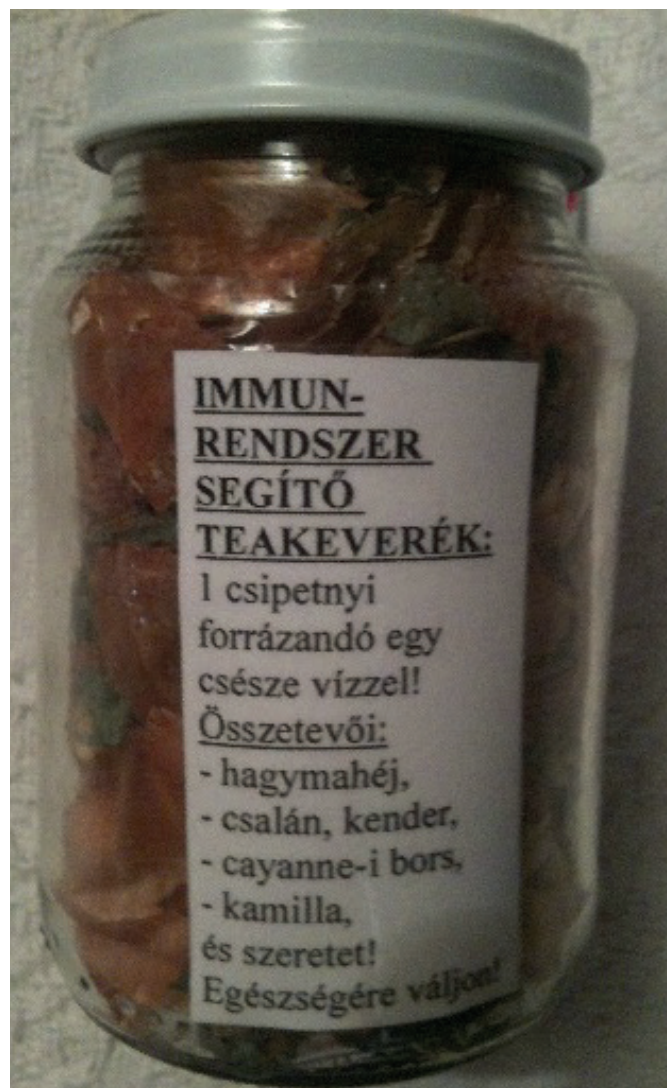
5. kép: Immunerősítés szeretettel. Szeged, 2016.

A „szürke”-, de különösen a „feketegazdasági” mező stratégiái beilleszthetők a második gazdaságfogalmába: „a második gazdaság az a szektor, amely magában foglal minden olyan termelő és elosztó tevékenységet, amelyek a magánhaszon szerzésére irányulnak és sértik a fennálló jogrendet” (Grossman 1982: 245). A második gazdaság szegmensébe tartozó gyógyító tevékenység, illetve a termékek árusítása olyan viselkedésmódokat, kommunikációt és érvényesülési stratégiákat kíván meg, amelyeket az egyének – legtöbb esetben – maguk alakítanak ki. Koltay Erika érzékletesen ábrázolja, amint „a főként egyéni szinten folytatott, és az emlékezetben még élő népi gyógyító gyakorlat találkozott a (...) természetgyógyászatot jellemző eszmeáramlatokkal. [...] Aki eddig csak csontkovácskodott, most már ingázik is, aki eddig csak gyógynövényeket ismert [...], most már masszíroz is és a reinkarnációban, valamint gyógyító energiában hisz” (Koltay 2002: 170).