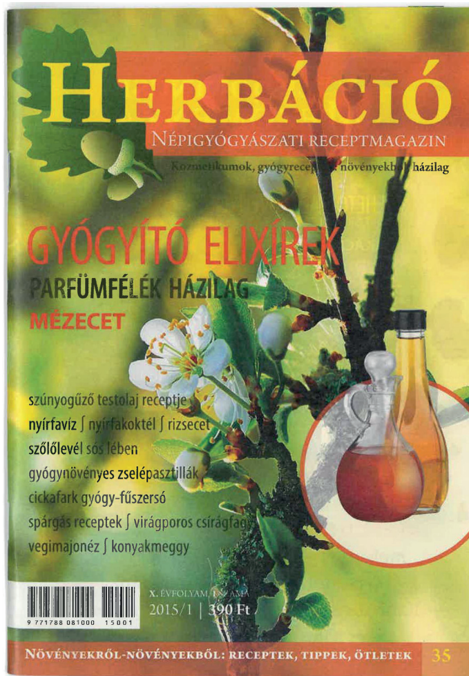
2. kép: „Herbáció – Népi gyógyászati magazin”, 2015. A szerző felvétele.

Népi specialista: esetükben a természettel való összhang a fő jellemző. Az embert a makrokozmosz részeként képzeltek el és gyógyításához a természetben talált anyagokat használták fel. Erre a népi gyógyászat fogalmának vizsgálatakor is utaltam.