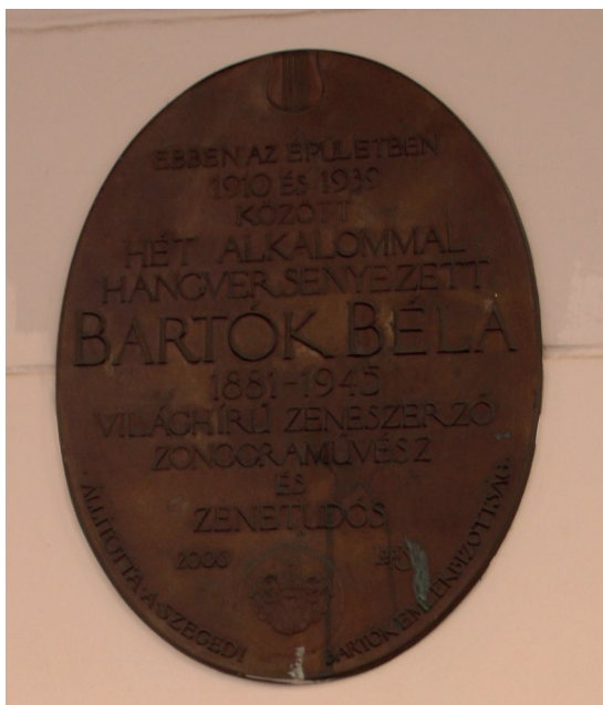
6. kép: A Bartók Béla emléktábla, Szeged, 2017. A 90-es évek második felében elindított sorozat tagjaira a sajátos ovális forma jellemző.