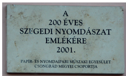
3. kép: A 200 éves szegedi nyomdászat emlékére emléktábla, Szeged, 2017.