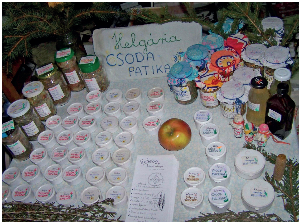
1. kép: „Gazdag termékkínálat sokféle bajra. Szeged, 2015.

Ez utóbbiakat interjúalanyaim gondosan mérlegelik, törekednek az információk hitelességének kiderítésére. A folyóiratok közül sokan forgatják a Herbáció magazint, valamint a könyvek közül