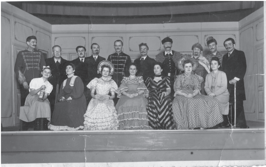
4. kép: A Művelődési Ház színjátszó csoportja első előadásként A Noszty fiú esete Tóth Marival c. darabot adta elő 1954-ben.