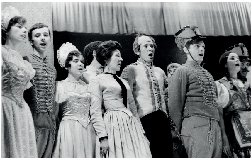
5. kép: A Mária főhadnagy szereplői 1970-ben a Művelődési Ház színpadán.