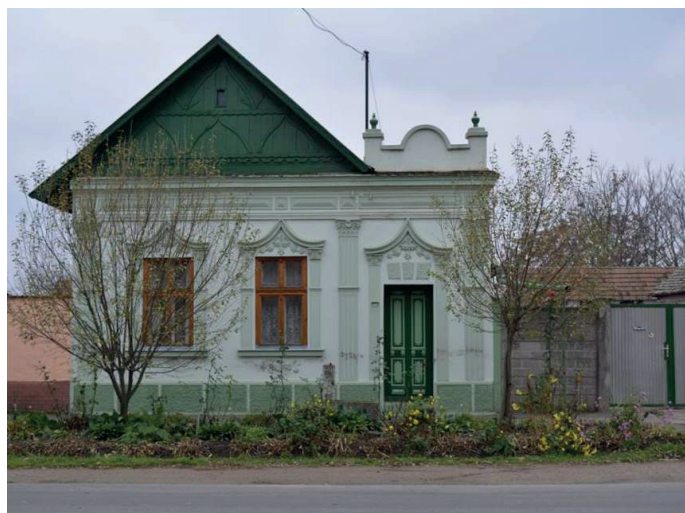
2. kép: Justh Gyula utca 39. Eklektikus stílusú lakóház, 2015.

Eddig egy ilyen lakóhárról van tudomásom. A Justh Gyula utca 39. szám alatt álló parasztház az, melynek utcafrontját négy éve a tulajdonosok saját kezűleg felújították. Vakolatdíszzeit rekonstruálták, ablakaikat az eredeti mintájára legyártatták, a legalsó színréteg színének megfelelően a falat átfestették, a romantikus stílusban épült kiskapu kerámia díszzeit rekonstruálták. Úgy gondolom, példaértékű, szépen kivitelezett felújításról van szó, melynek motivációja a következő volt: téves információ vagy meggyőződés végett a tulajdonosok azt hiszik, hogy házuk védettség alatt áll. Állításuk szerint mikor a renoválás támogatásával kapcsolatban az önkormányzathoz fordultak segítségért, anyagi támogatást nem kaptak, azonban tudtukra hozták, hogy a vakolatdíszek megsemmisítése pénzbüntetést von maga után, holott az épület nem szerepel a védettségi listán.