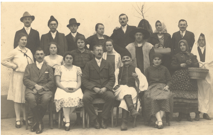
2. kép: A Szőlők Közötti Iskola színjátszói a Nánai bíró leánya c. színdarab előadása előtt 1929-ben.