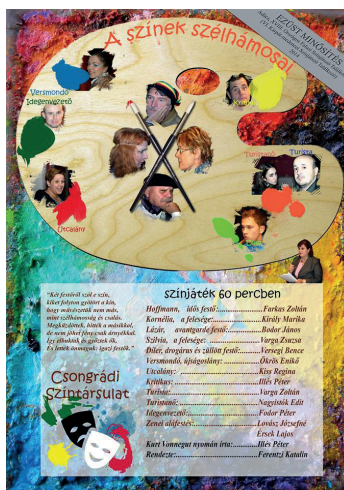
6. kép: A színek szélhámosai c. színdarabbal 2014. novemberében ezüst minősítést nyert a Csongrádi Színtársulat a XVIII. Országos Falusi Színjátszó Fesztiválon, Adácson.