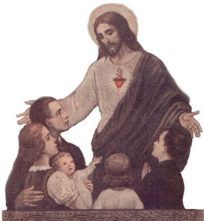
5. kép: Jézus Szíve tisztelet a családban, 1944.

A felsorolt példák azt mutatják be, hogy az egyház miként törekedett az első világháború után a gyermekek nevelése által a társadalom jobbá tételére. A társadalom átalakulása új kihívások elé állította a papokat és a tanítókat egyaránt, akik a többi világnézethez hasonlóan a gyermekek megszólítására törekedtek. Mivel az elhatározáson kívül nem volt más kritériuma a Szívárdához való tartozásnak, több ezer gyermeket tudtak bevonni a mozgalomba. Ha a gyermekek betöltötték a 14-15 éves kort, akkor is csatlakozhattak más közösségekhez: a középiskolások a Jézus Szíve Testőrgárdába, az ifjak az Ifjak Jézus Szíve Szövetségébe, a lányok a Jézus Szíve Leánykörbe. A felnőtteknek nemek szerint volt szövetsége (Zsíros 1939: 6-7). A mozgalom a katolikus megújulás keretében a vallásgyakorlás premodern formáinak modern keretek közé történő átmenetéseként is értelmezhető. Az egyén a közösség és a társadalmi intézmények kapcsolatára mutat rá. A téma vizsgálata a társadalomtörténet szempontjából is fontos ismereteket szolgáltat.