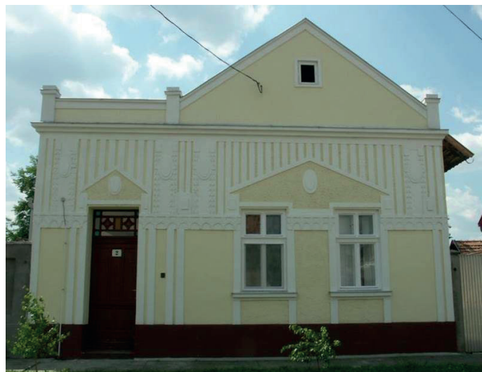
1. kép: Báró Jósika utca 2. szám alatt található, helyreállított, 1920 körül eklektikus stílusban épült lakóház, 2004.

2004-ben egy újabb felmérés készült, melyet egy örökségvédelmi hatástanulmány is kísért, amely azt a tanulságot vonta le, hogy Makó építészeti öröksége a „védelem” ellenére pusztul. A folyamat megállítása és visszafordítása érdekében, sok egyéb mellett javasolta például az épületek állagmegőrzése céljából az anyagi források biztosítását. Ennek megvalósulása az elmúlt két évben vette kezdetét, ugyanis az önkormányzat pályázatot írt ki, melyre a helyi védettség alatt álló házak tulajdonosai pályázhatnak az épület külsejének rendbehozatala céljából.