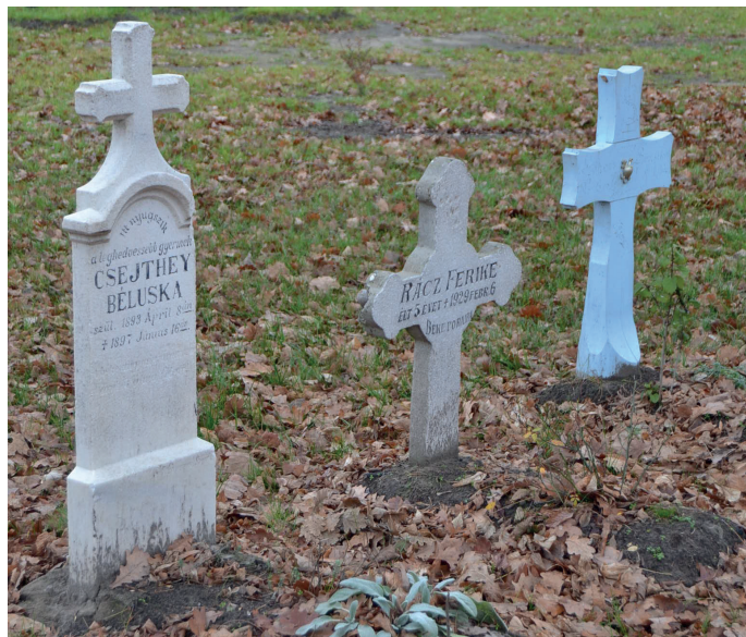
4 kép: Gyereksírok külön „parcellában” elhelyezve, Ópusztaszer, 2015.

Már nem következetesen, de a fakereszteken megjelenik a sírjel színezése, mint a megélt életkor jelzője. Itt a világos szín fiatalon meghalt személyre utal. Ez a sírokra telepített növényzetben is tetten érhető, hiszen a külön parcellában elhantolt gyermekek sírjain a tisztaság jelképeként megjelenő fehér virágok dominálnak.