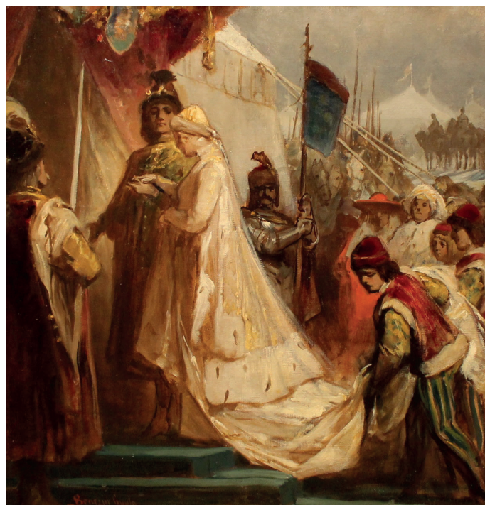
1. kép: Benczúr Gyula: Mátyás és Beatrix , 1902 után.

hanem rögtön dízsátrába vezette, ahol Veronai Gábor egri püspök és kancellár olasz beszéddel fogadta az ifjú arát (Fraknoi 1890: 248-249).