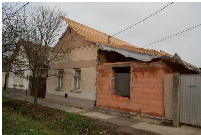
3. kép: Nagycsillag utca 43. Átépités alatt álló parasztház, 2015.

Az ebbe a csoportba eső házak tömegével országsszerte lehet találkozni. Pár általános példát kiragadva: ezeknél a házaknál megfigyelhető az ablakok cseréje, a színezett kőporos vakolat, a ház falsíkjának arányát fölborító hozzátoldás, bővítés. Ezek a változtatások történhetnek szerényebb kivitelezésben, illetve anyagi ráfordítást nem nélkülöző kivitelezésben egyaránt.