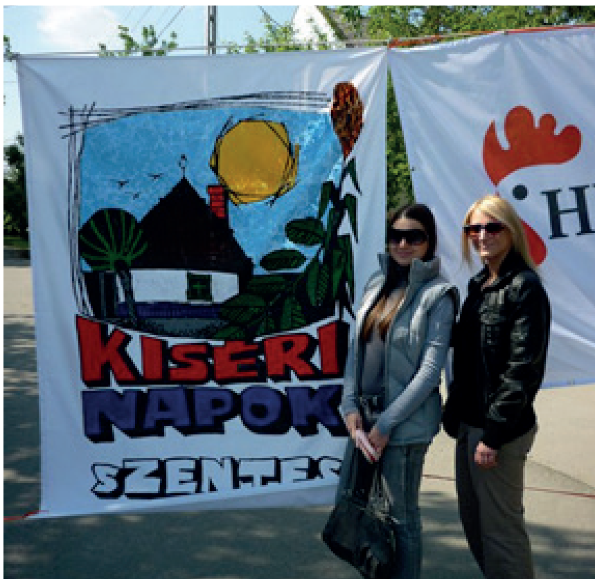
1. kép: Kiséri Napok, Szentes, 2013.