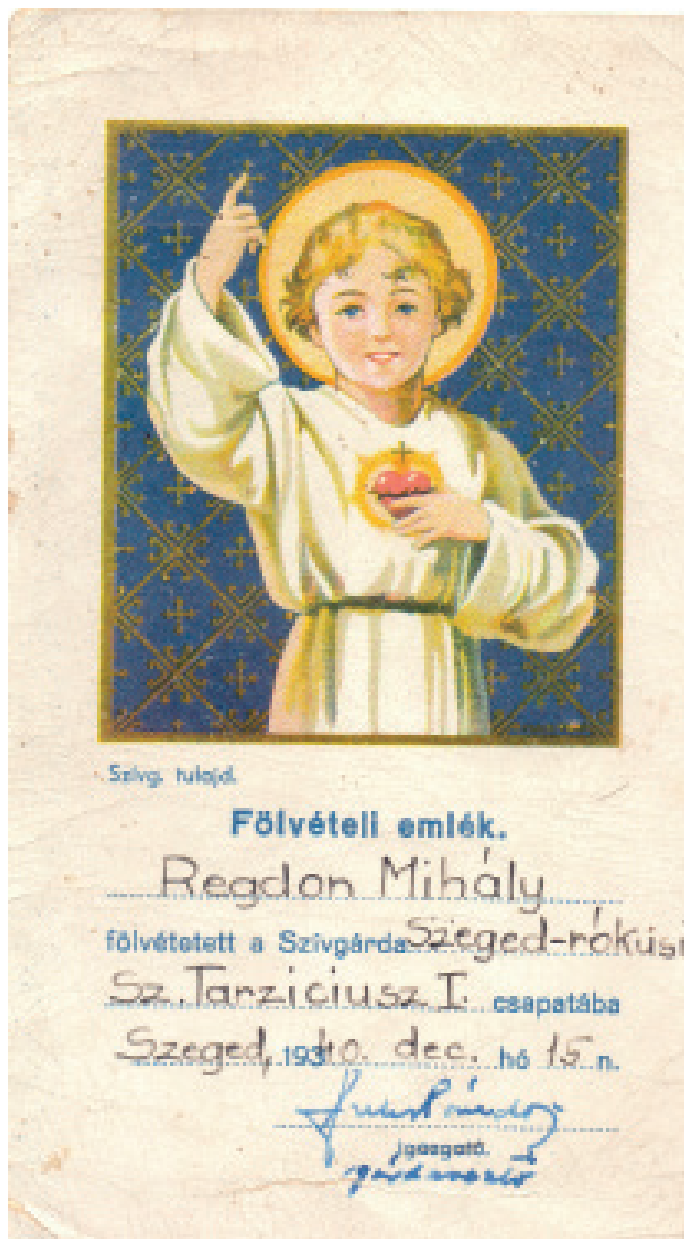
1. kép: Szívárdá felvételi emlék, 1940.

A Szívárdá vallásos gyermekegyesület, a Jézus Szíve Szövetség gyermektagozata volt, amely 6 és 14 év közötti diákokat fogott össze (Frauhammer 2014: 139-140). Célkitűzésükben megfigyelhetőek a Katolikus Akció elvei, vagyis nagy hangsúlyt fektettek a gyermekek apostolkodására. Ezt főként a közvetlen környezetükben (család, barátok) tudták megvalósítani.