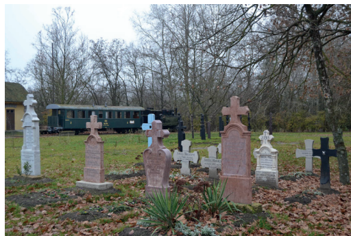
2.kép: A katolikus temetőrészlet, Ópusztaszer, 2015.

A sírhantok között járva látható, hogy amint az élőknél, úgy a „holtak falujában” is tükröződik a család befolyásossága, anyagi helyzete. A sírhely elhelyezkedése a temetőben (pl. út menti, első sor), a sírhely mérete; a sírjel anyaga, nagysága, díszítettsége mind-mind a család, az elhunyt személy rangját is mutatja. Ez megjelenik a sírra telepített növényzetben is. Ugyanakkor számos más körülmény is közrejátszhatott abban, hogy milyen sírkereszt került a hantra. A hagyománytisztelet által, vagy éppen egy korábbi, már féltetett sírjel újrafaragásával egészen archaikus formák is megőrződtek. Ilyen az első sorban található szív alakú kereszt is.