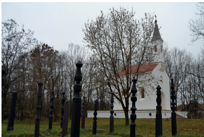
1.kép: A rekonstruált kápolna, előtérben a református temetőrészlettel, Ópusztaszer, 2015.

stációból álló kálváriát, egy katolikus és egy református temetőrészletet, egy út menti keresztet és két szobrot.