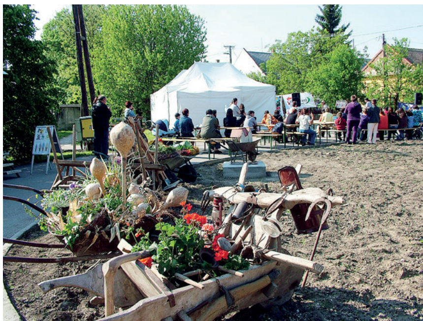
2. kép: Talicskaszépségverseny, Kiséri Napok, Szentes, 2011. Városi Visszhang felvétele.