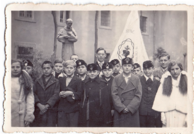
2. kép: Szívárdisták, é.n.

A Szívárdában történő vallásos nevelés célja olyan katolikus felnőttek felnevelése volt, akik ezeket az értékeket a saját családjukban is tovább fogják adni. Az egyes, az egyházi értékrenddel össze nem egyeztethető értékeket valló nézetek közül leginkább a baloldali gyermekmozgalmakat tartották elkerülendőnek. Ezért a gyermekek lelkére leginkább leselkedő veszélyként egyrészt a Gyermekegyesület nevű szocialista egyesületet nevezték meg, másrészt a „ korban uralkodó erkölcsrontó és tekintélyromboló tényezőket. ” (Szabó 1930: 165) Ezek voltak: az istenkáromlás, a szentmisék és a szentáldozás elmulasztása, az erkölcs elleni vétkek, a másoknak okozott anyagi és erkölcsi károk.