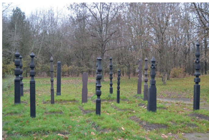
5.kép: A református temetőrészlet, Ópusztaszer, 2015.

Ebben az esetben az alapot Csalog József írása (Csalog 1957), illetve Szakál Aurél Szentesi fejfák című tanulmánya (Szakál 1995) jelentette. Miután a szentesi múzeum adattárában és fotótárában bebizonyosodott, hogy a tanulmány megírását igen alapos, jól dokumentált gyűjtőmunka előzte meg, ez alapján kezdtem meg a rekonstrukciók előkészítését. Az adattárban talált gyűjtőfüzetek rögzítették a fejfák formáját, méretét, a rajta található sírverset, illetve a hozzá tartozó fotók azonosítóját.