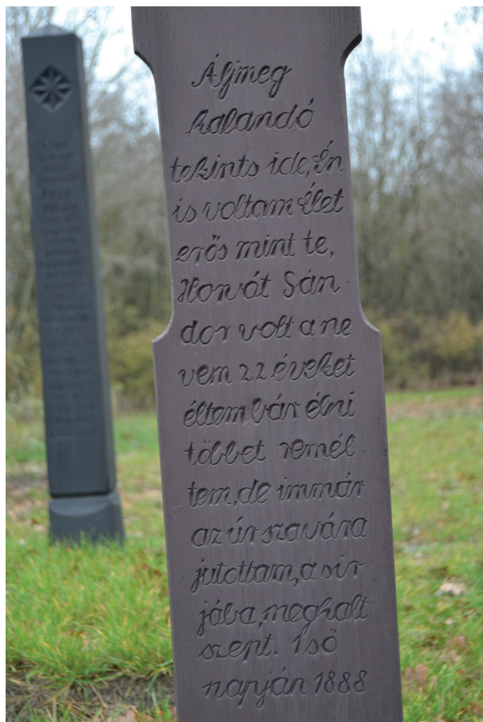
6.kép: Sírvers rekonstruált deszka fejfán, Ópusztaszer, 2015.

Mára a temetőkultúra olyan komoly változáson ment keresztül, hogy a legtöbb látogató a bemutatott jelenségeket nem hogy értelmezni nem képes, sokszor nem is érzékeli. Ezt felismerve készítettem egy összefoglalót, melynek segítségével a bemutatóhelyen lévő teremőr – egyebek mellett – segítheti az egykori temetkezési kultúra megismerését, megértését. 6 Ezzel együtt talán oldhatja a látogatókban azt az ösztönös idegenkedést a témától, amellyel munkám elején nekem is szembesülnöm kellett.