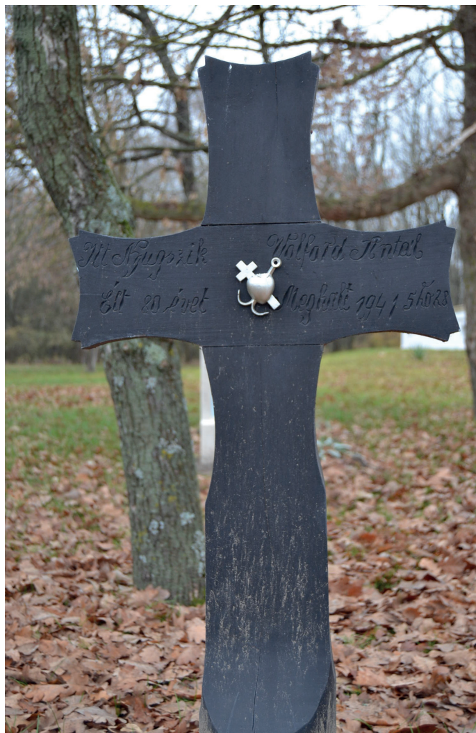
3.kép: Fakereszt rekonstrukció, Ópusztaszer, 2015.

Számos díszítőelem, motívum megjelenik a kereszteken. Ilyen a feszület, IHS (Jézus görög nevének /IHSOYS/ rövidítése), amelynek azután számos föloldása született. Talán közöttük legismertebb: „Isten házába siess!” Megjelenik a koszorú, a szomorúfüz, illetve a fakeresztek különleges formájú rögzítő szege. Az egyszerűbb, kovácsolt szív alakú szegek mellett találunk összetettebb, keresztet, horgonyt és szívet ábrázoló szegeket is, amelyek a hit-remény-szeretet összevont szimbólumai.