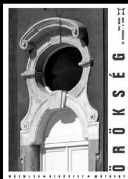
A címlapon: Laffert-kúria, az udvar felőli, kőkeretes, felülvilágítóval egybekapcsolt bejárati ajtó részlete