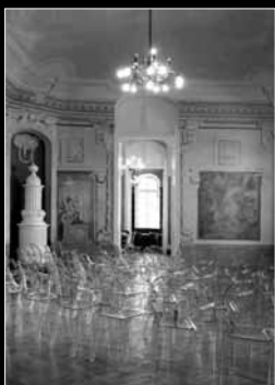
A hátsó borítón: A Laffert-kúria restaurált díszterme Dunaharasztiin