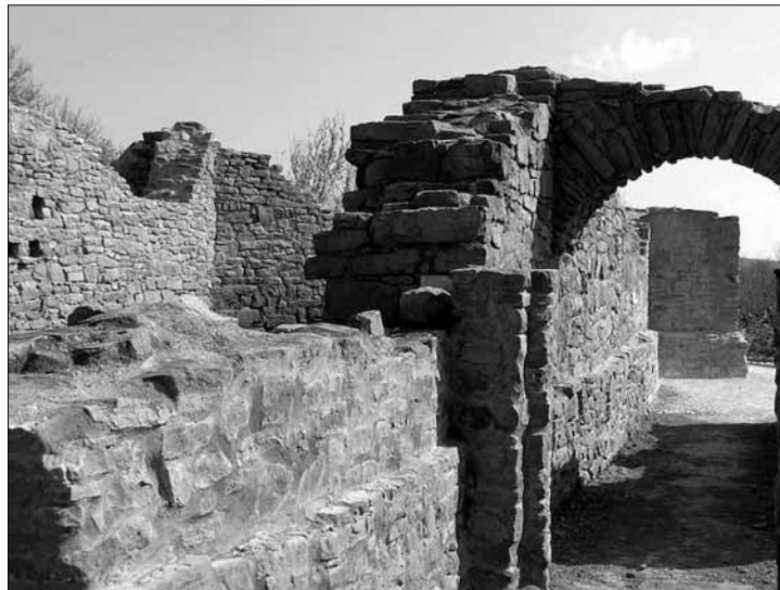
Pécs Jakab-hegy pálos kolostor maradványai