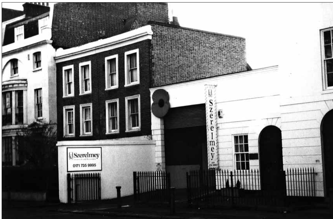
A Szerelmey cég székházának bejárata Londonban, a Temze délpárt oldalán

Az osztrák hadseregtől való távozása után a több nyelvet beszélő, romantikus természetű Szerelmey Párizsba ment, litográfiát tanult, majd Brüsszelben is megfordult, sőt a belga függetlenségi felkelésben meg is sebesült. Felgyógyulása után bejárta szinte a fél világot: Amerikától Kisázsiaig. Visszatérve utazásaiból először Bécsben, majd 1844-től Pesten