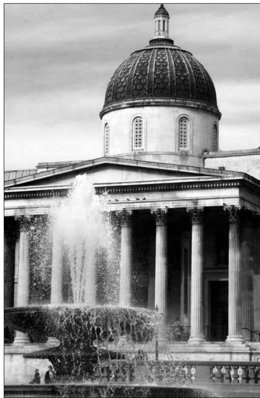
London: A Szerlemey cég egyik legismer- tebb restaurált épülete a National Gallery

„...a társaság még emlékszik a szeretet és a büszkeség vegyes érzésével, az igen tehetséges, kicsit küllönc és bogaras, de nagyszerű egykori alapítójára.“ ■