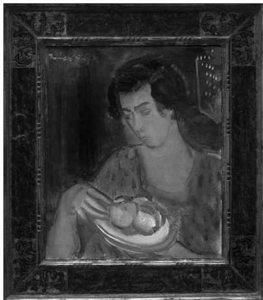
Márffy Ödön: Annuska