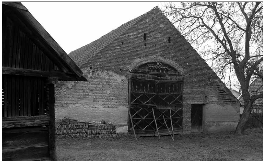
A hatalmas telkek, a nagyméretű nyeregretetős lakóházak és a csarnokméretű „cifra csűrök“ alkotta falukép tömeghatásában még keveset változott 250 év óta. Vállaj – Szabadság út. 2

Jelenleg a templom melletti első, jó állapotban lévő, vakolatdíszes, tipikus sváb porta műemléki védelme folyik, amely nemcsak a legszebb, de igen sok benne még az eredeti. Ezenkívül javasoltuk a 2005-ben „felfedezett“ értékes vas és kőkeresztes 19. sz.-i te-