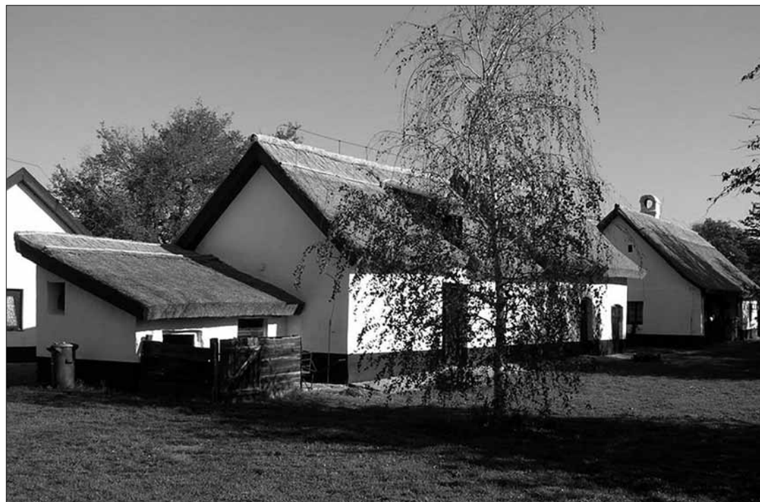
Lakóbáz a műemléki védelmet kapott hajdúböszörményi Polgári zugban.