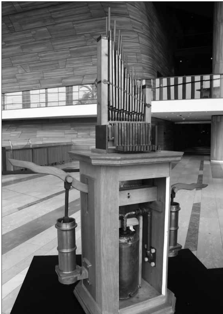
A Minárovics János által tervezett 2007 évi rekonstrukció

ismerése kívánatos volna ugyan, de mégsem lényeges.“ – HJ.)