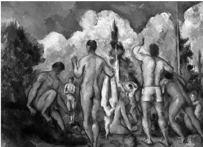
2. kép: Paul Cézanne: Fürdőzők

( http://www.irodalmiradio.hu/femis/muveszetek/4muveszek/c_menu/cezanne/nagyfurdo.htm )