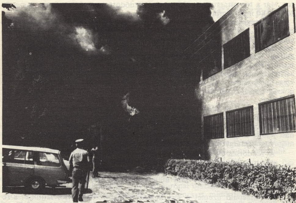
Tombol a tűz, fojt a füst