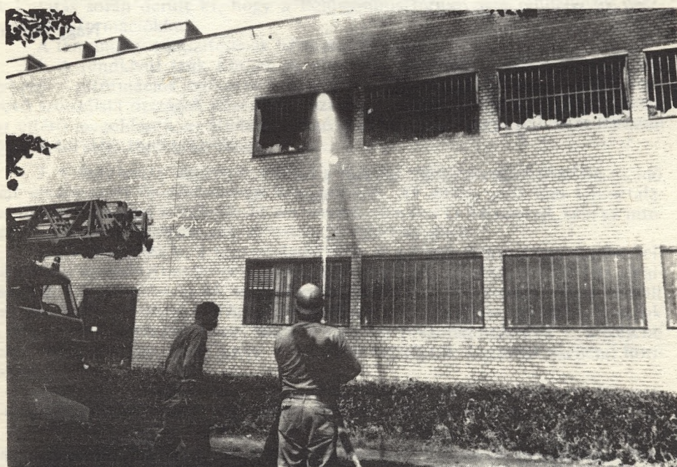
Hűtés az utcáról