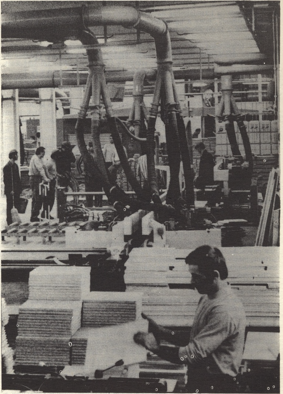
Budapesti Faipari Vállalat