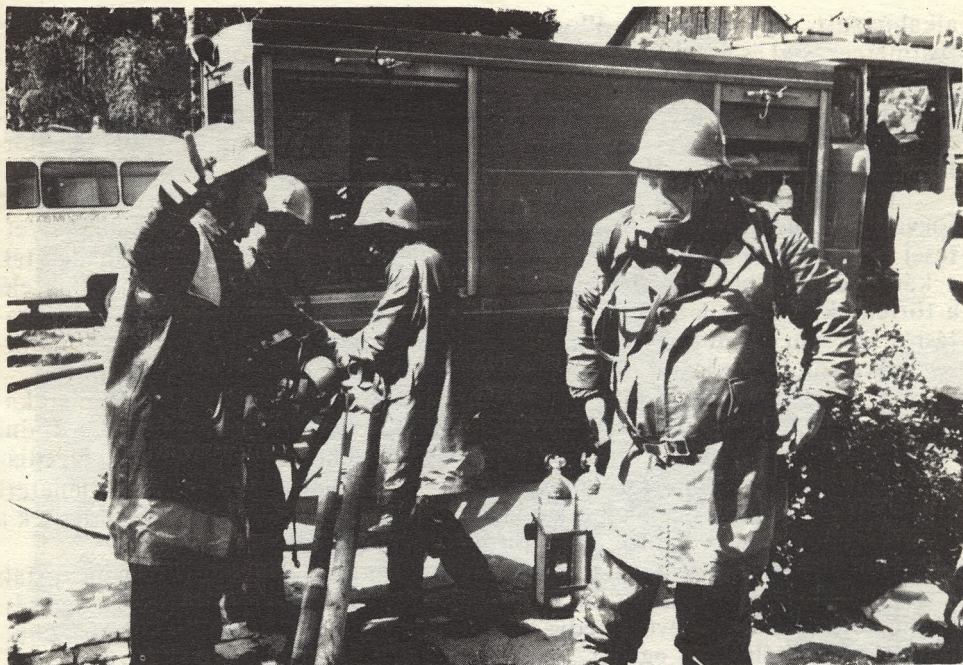
Légzőkészülékben indul a kutatócsoport