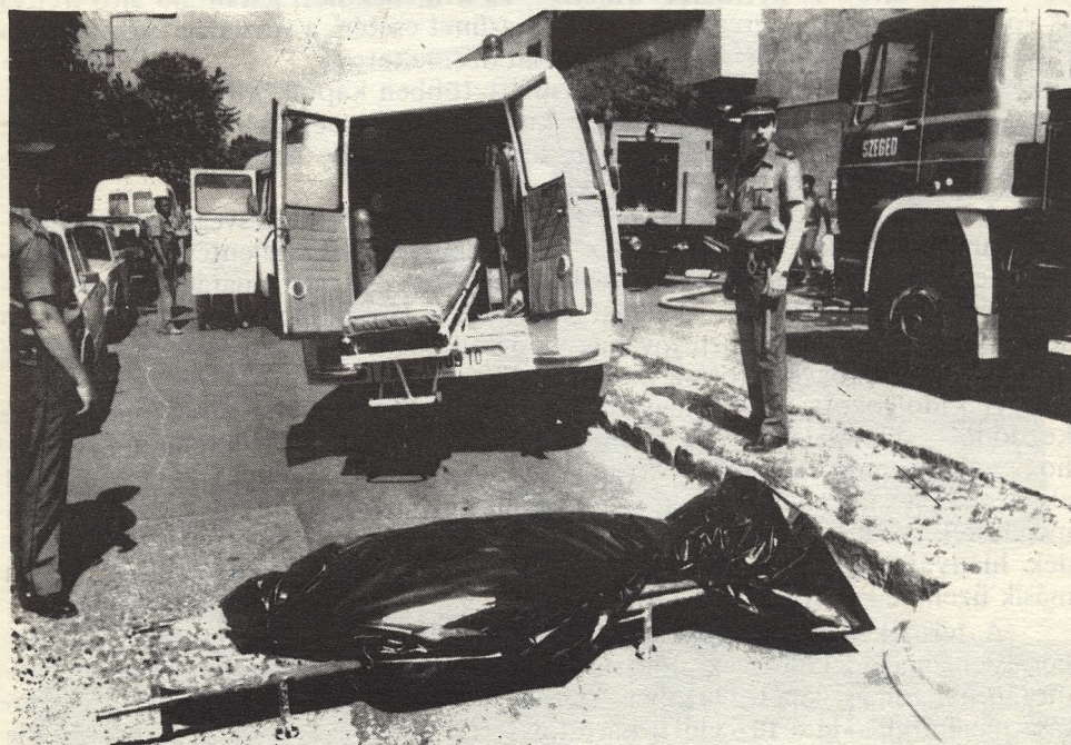
A mentők már nem segíthettek...