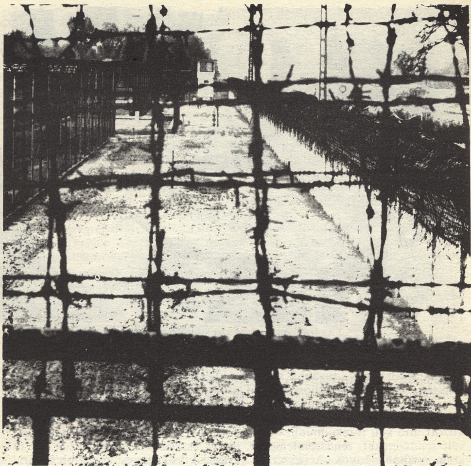
A kerítés melletti biztonsági sáv egy szakasza

riadócsoport felesleges mozgását, másrészt, amikor a rendszert egy személy sérti meg, lehetővé válik – bizonyos határok között – az egyén mozgásának és tevékenységének megfigyelése.