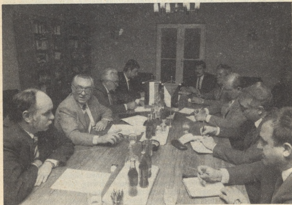
Magyar küldöttség Lengyelországban, csehszlovák delegáció nálunk