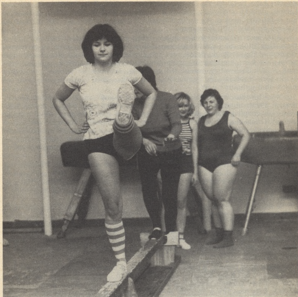
A jelszó: testmozgás ...

nézzük meg, melyik étel mennyi energiát tartalmaz. Így hamar, kis fáradsággal tudatos táplálkozónak válhatunk, aki kiegyensúlyozottan étkezik, nem fűti túl (talán a katasztrofális robbanásig) a szervezetét.