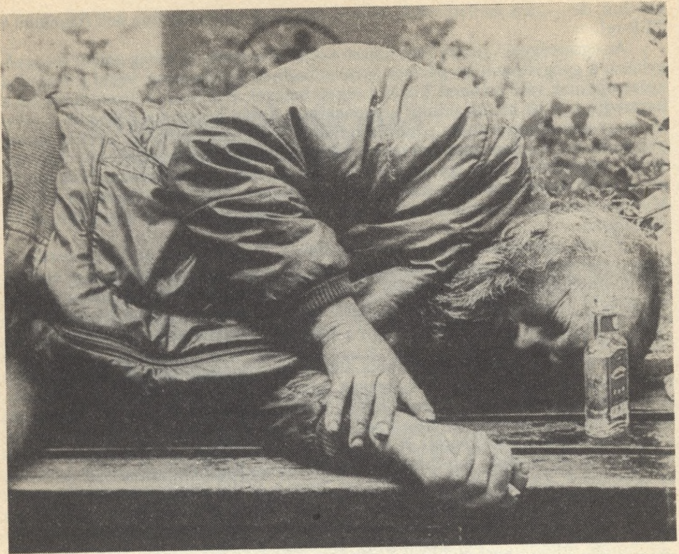
„A mértéken felül minden pohár átkozott”

csolódni, életmódot változtatni. Gyógyszereink igen hatékonyak, de mindegyik számos mellékhatással bír. Ezek pedig kivétel nélkül kisebb-nagyobb mértékben károsítják a szervezetet. A tanulság magától értetődő: gyógyszert csak orvosi tanácsra, előírt mennyiségben, meghatározott időtartamig lehet szedni.