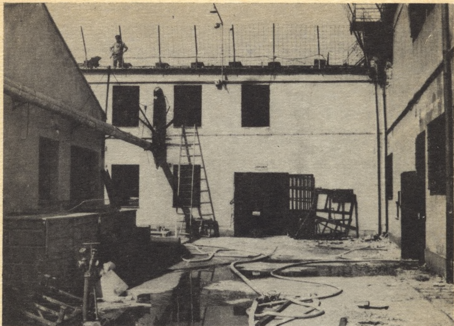
Emberáldozatokat követelő tragikus tűzvész pusztított az Alföldi Bútorgyárban