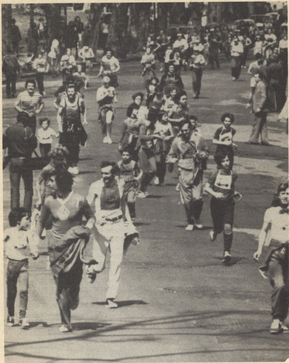
Ma talán a kocogás az egyetlen tömegsport

több az arany középút! Ahogy senkinek se ajánlanék 0 kalóriás fogyókúrát, úgy senkinek sem javaslok heti 25 km-nél többet — még egy maratoni futás dicsőségéért sem.