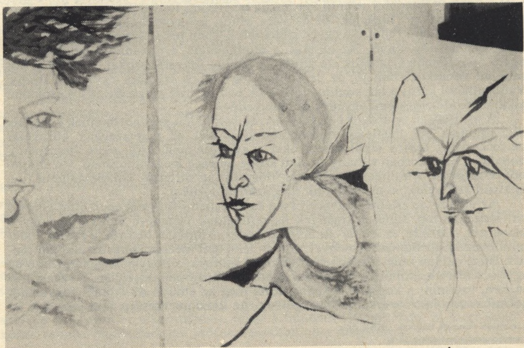
Egy beutalt rajzai

Az emlékülés második részének első előadója (függelék: 5) öt bűnelkövető elmebeteg férfi kényszergyógykezelt esetét mutatta be. A betegekkel családrajzot készíttetett. A grafikus ábrázolás a meg nem fogalmazódó feszültségek, elfojtott tudattartalmak megjelenítésére mindig kitűnő lehetőséget ad. Az elkészült rajzok közvetlen és közvetett értelmezése magyarázattal szolgálhat a vizsgálónak, jelést adhat a betegségről, a beteg problémáiról, a beteg gondolat- és érzelmvilágáról.