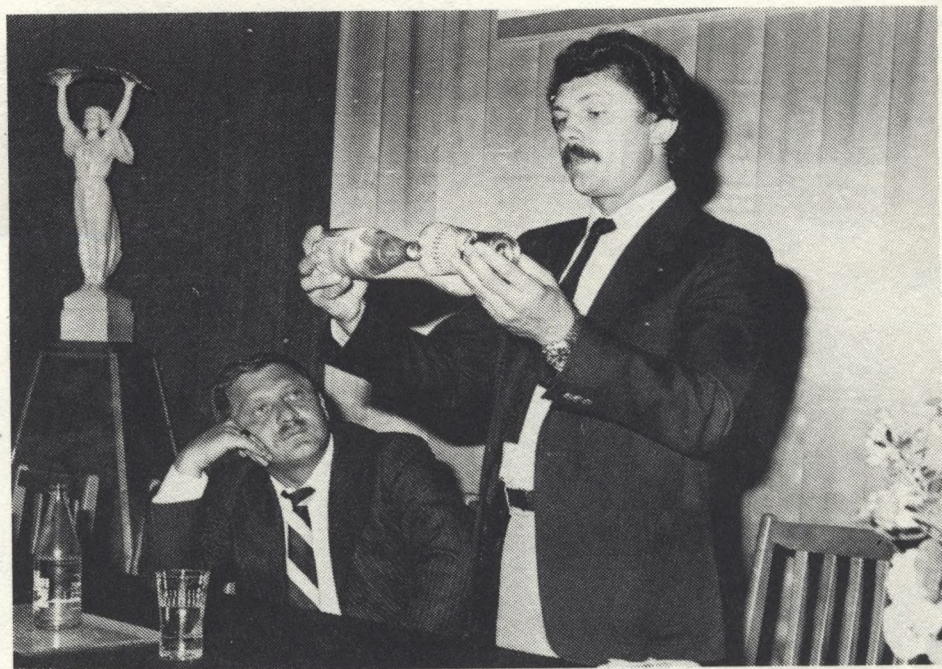
A Miskolci Bv. Intézet személyi állománya és családtagjai szeretettel fogadták Farkas Bertalan úrhajós alezredest, aki nagy érdeklődéssel kísért élménybeszámolót tartott számukra