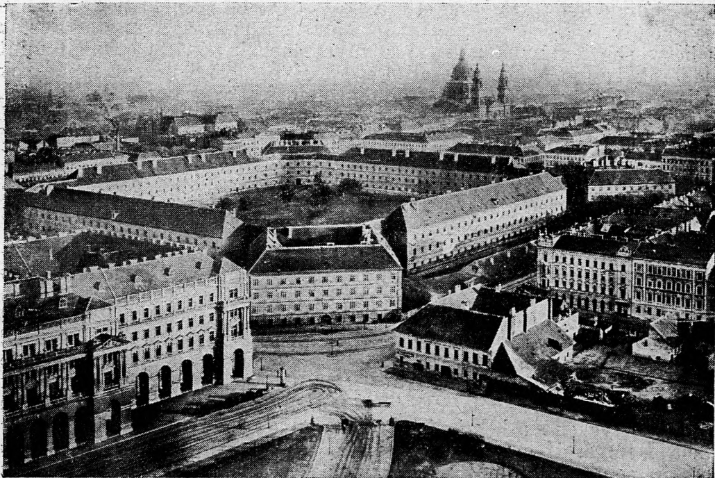
Az Újépület látképe a lerombolás előtt.