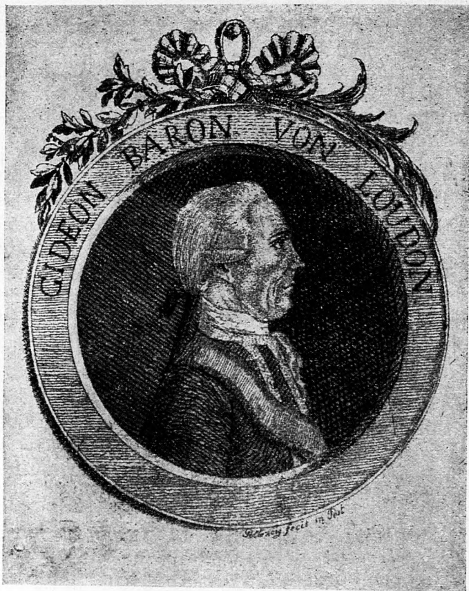
Báró Laudon Gedeon arcképe.

Hogy a mozgalmas 1789. esztendő néhány fontosabb eseményének hírlapi feldolgozását bemutassuk, néhány esemény leírásának