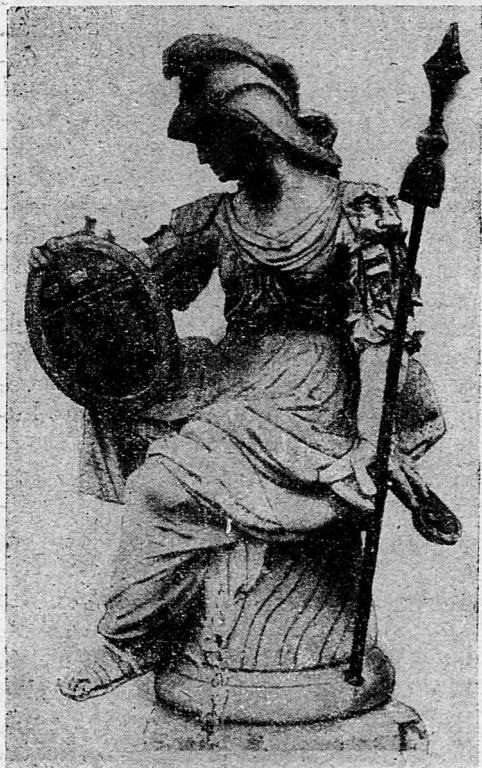
A várbeli Athene-szobor.

Budán, a Szentháromság-szobortól balra, egy kút állott, amely fölé — annak emlékére, hogy 1718-ban Szent Ignác ünnepének előestéjén folyott benne először Kerschensteiner jezsuita atya tervei szerint a Svábhegyről idevezetett víz —