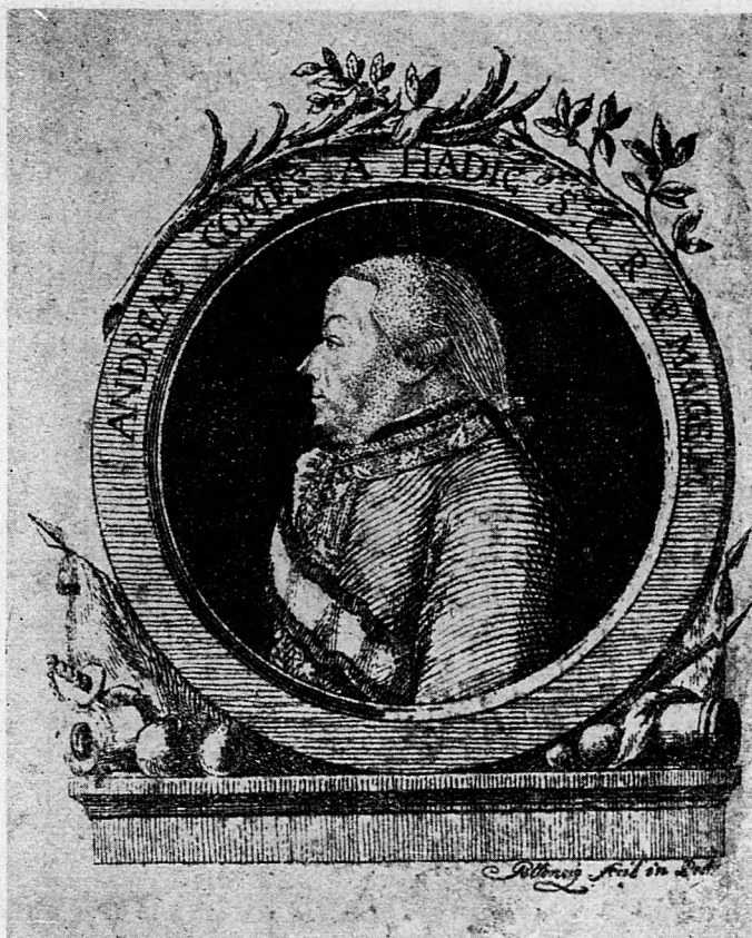
Gróf Hadik András arcképe.

a folyó események fontosságának megfelelően július 7-től a laphoz függesztett Extrablatt -ban híven beszámol az itt történekről. Lépésről-lépésre elmondja az itt működő hadseregesoportok teljesítményét, míg végre július 11-én hosszú jelentésben számol be a győzelemről és Berbir várának július 9-én történt megszállásáról, amelyet több számon át közöl. A horvátországi hadműveletek végre is Belgrád elfoglalására — az egész hadjárat egyetlen jelentős fegyvertényére —