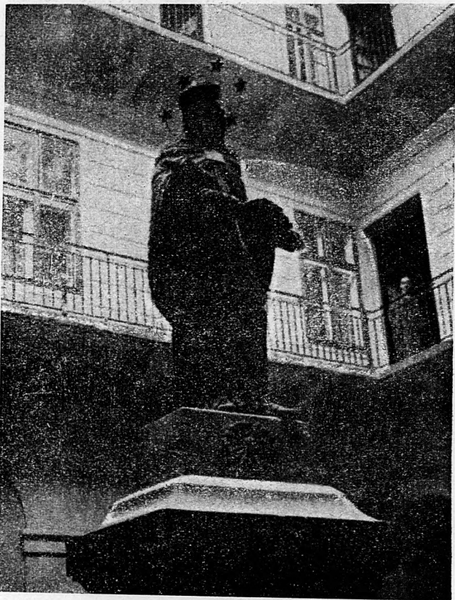
Az Eötvös-tér 2. szám alatti ház udvarán álló Szent János-szobor.

E jelentés alapján József nádor 1820 január 27-én kelt leiratában megengedte, hogy mihelyt a sóhivatal Vámház-téri új palotájába költözik, ez a kápolna lebontassék, mert azontúl nem szolgálhat többé eredeti rendel-