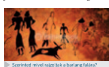
► Szerinted mivel rajzolták a barlang falára?

Az írás története voltaképp a képirással kezdődött, ami majdhogynem rajzok sorából állt. Őseink leegyszerűsített ábrákkal – mai szóval piktogramokkal – rögzítették a mondanivalójukat. A képeket bárki megérthette, aki rájuk nézett, hiszen a valósághoz hasonló ábrákat rajzoltak. Nem is kellett hozzá olvasni tudni. Nem véletlen, hogy piktogramokat ma is használunk (gondolj csak a tömegközlekedési eszközökön elhelyezett, különféle szabályokat közlő ábrákra). Ezeket, akárcsak őseink képirását, bárki megérti, aki rájuk néz.