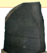
► A rosette-i [rosetti] kő. Nézz utána, miért fontos ez a lelet!

Biztosan láttál már képeket az egyiptomi piramisokról és az azok falát díszítő, gyönyörű ábrákról. Ezeket a rajzos írásjeleket hieroglifikának nevezzük. A Kr. e. 4000 körül keletkezett egyiptomi hieroglifik embereket, állatokat, tárgyakat ábrázolnak, amelyek szavakat, szóta-