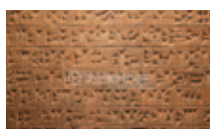
► Tudod-e, hol éltek a sumérok?

gokat is jelölhettek. Megfejtésükre sok kutató tett kísérletet, de még nem mindnek ismerjük a jelentését.