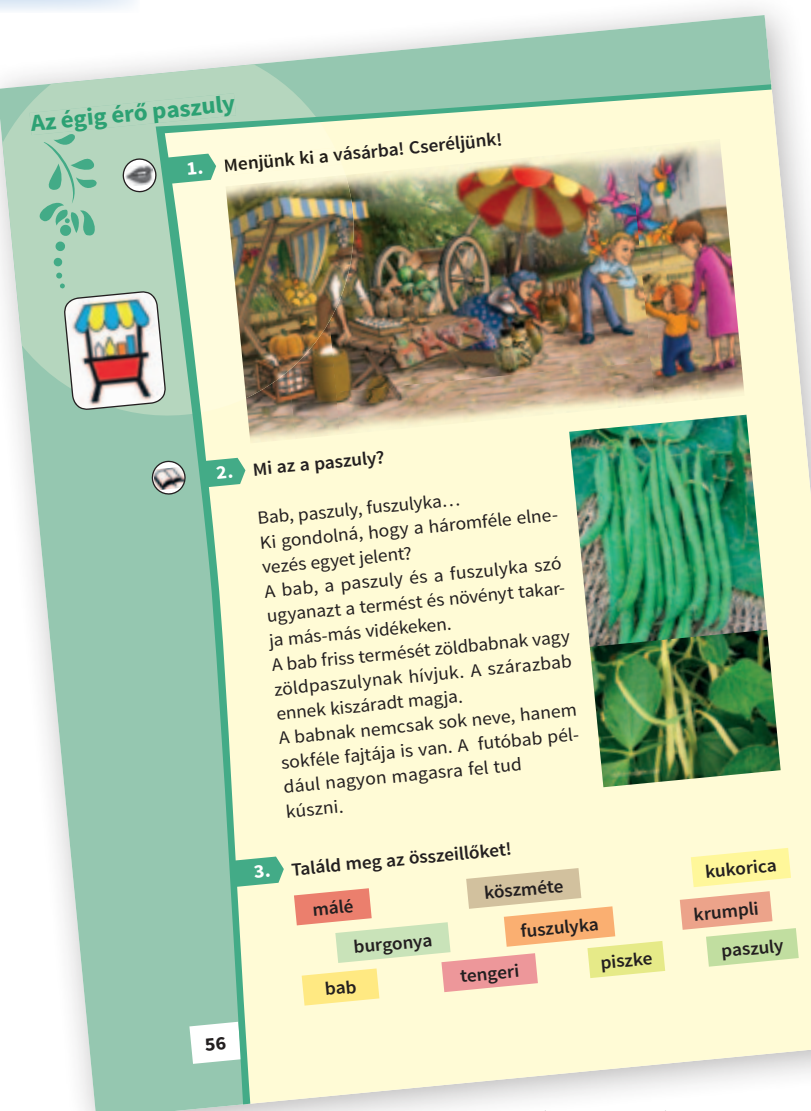
Olvasókönyv 2. (mintaoldal)

– Mindig a konkrét valóságból kiindulva építkezünk az absztrakció irányába. Minden olvasmányt megelőz egy előkészítő feladatsor, egy beszélgetés, ráhangolódás. Ezzel előhívjuk a gyerekek előzetes ismereteit. Másodikban az olvasási rutin kialakítása az elsődleges feladat, emellett szeretnénk kedvet csinálni az olvasáshoz. Az olvasás stratégiai módszertanával megalapozzuk már másodiktól azt a struktúrában gondolkodást, ami már a tanulás tanulását készíti elő, és nagyon fontos lesz felső tagozatban és később is. Ezt a célt szolgálják az új elemként megjelenő, a szövegfeldolgozást segítő kártyák. Ezek a kártyák a szövegeket kísérik: működhetnek memóriafogasként, de aktívan használhatóak az absztrakciós folyamatban is. Szeretnénk, ha a gyerekek hosszabb szövegeket is olvasnának. Kisebb részegységre tagoljuk a szöveget, beiktatunk megállókat, ahol a tanítók megbeszélhetik a gyerekekkel, hogy mi történt eddig, és mi következhet ezután. Ezeket a megállókat a szöveg végén összegezzük, és megpróbáljuk rendszerbe foglalni.