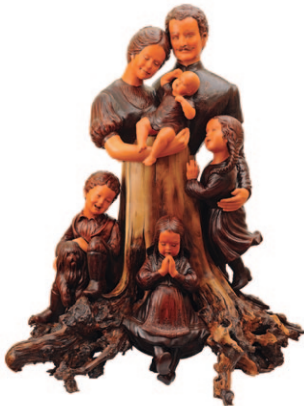
Józsa Judit: Magyar család

– A galériában, ahol beszélgetünk, szinte még alig száradt meg a festék, ragyog az üveg, új az ajtó, a berendezés... Rögös volt az idáig vezető út?