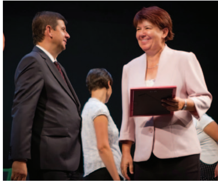
A Bonis bona díj átvétele

Családommal sok időt töltünk együtt, rengeteg programot szervezünk, úgy gondolom, hogy lányaimmal nagyon bensőséges, baráti viszony van köztünk. Szívesen járunk együtt színházba, moziba, koncertekre, sokat sétálunk. Ez az idő számomra a legfontosabb, hiszen a biztos családi háttér és támogatás az, ami nélkül nem tudnék helytállni a munkámban.