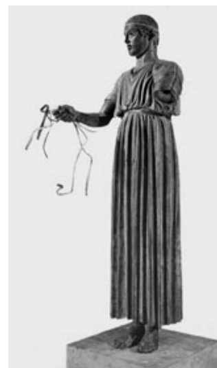
A delphoi kocsihajtó, Kr.e 470 körül

És hogy jön ide Ybl Miklós kétszáz éve? Úgy, hogy ő egy ellentmondásos, nehéz korban a tervezést, az építkezést, a nemzet felemelését választotta, a jövőnek dolgozott, az általa épített templomok, kastélyok többsége ma is áll, a pesti Operaház messze földön híres, a Várkert Bazárt pedig talán idén tavasszal már láthatjuk régi pompájában. Példák, témák tehát szép számmal akadnak, gondolkodjunk el rajtuk az új évben is.