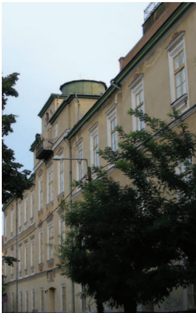
Az egykori Haynald obszervatóriumnak helyt adó kalocsai Szent István Gimnázium épülete