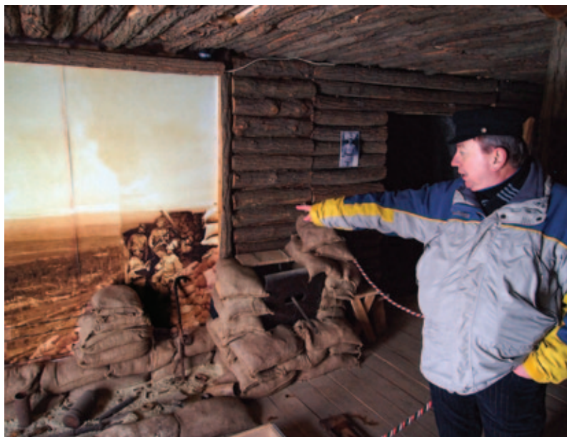
Élethű barakk az 1910-es évekből. Idén lesz a századik évfordulója az I. világháború kitörésének

A múzeumpedagógiai foglalkoztató egyedülálló a hazai kínálatban. A 19 oldalas, A/4-es formátumú színes füzet nemcsak rejtélyes feladatokat nyújt a helyszíni csapatmunkához, hanem szép emlék is hazavinni magunkkal. A gyermekek nyelvén írt kiadvány a felnőttek számára is kiváló összefoglaló mű a Magyar Honvédségről, hogy ismereteinket instant módon felrisszítsuk. Az eszközöket igénylő foglalkozásokhoz megfelelő helyszínt tud nyújtani az Emlékpark.