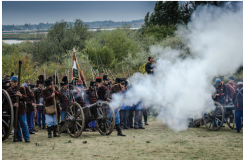
Időutazás minden év szeptember 29-én

Gyalogosan: A park szomszédságában található hazánk egyik legfiatalabb, de nagyon gazdag állománnyal rendelkező arborétuma, amelyben nemrég átadott kiállítás mutatja be a Velencei-tó állat- és növényvilágát. A Katonai emlékpark és az Arborétum kedvezményes közös jeggyel is látogatható.