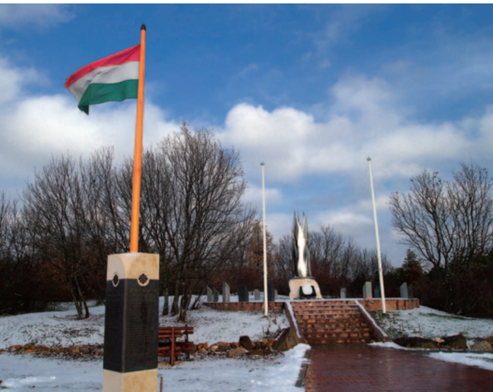
Pákozdi a tizenegy Nemzeti Emlékhelyünk egyike

A helyszín bejárása során dr. Görög István az egykori hadszíntér legmagasabb dombján – teljes körpanorámával a Velencei-tóra és a Velencei-hegységre –, fogalmazta meg talán a legfontosabb és örökérvényű gondolatot, hogy a történelem ismerete, és annak pozitív hozománya nem abban rejlik, hogy adott évszámokat, szakkifejezéseket bemagoljunk, hanem abban, hogy a szálakat értelmezve képesek leszünk összefüggésekben gondolkodni. Akárcsak a hétköznapi életben, de nem matematikai alapon, hanem a lehetséges verziók elemzésével árnyaltan gondolkodni.