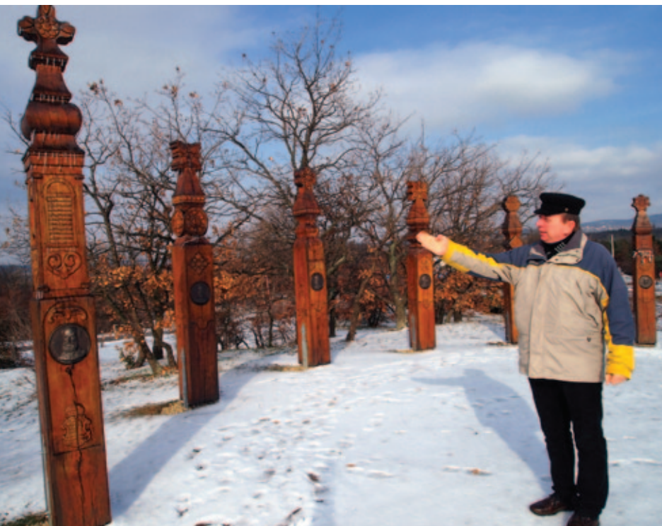
Az aradi vértanúk tiszteletére emelt Vértanúk emlékműve

Emlékpark is arra törekszik, hogy területet biztosítson a családoknak, az iskolai és munkahelyi közösségeknek. Természetesen valljuk, hogy a hazafias-honvédelmi nevelés legfogékonyabb korosztályát a gyermekek adják, ennek megfelelően számukra dolgoztuk ki legaprólékosabban a programjaink döntő többségét. Ilyen a „Hazafiság Iskolája”, mely a Nemzeti alaptantervhez, az iskolák pedagógiai programjaihoz – természetesen elsősorban a történelem, hon- és népismeret, környezetismeret, földrajz és biológia tantárgyakhoz – kapcsolódóan kínál egész napos pedagógiai programot, ismereteket és élményeket a Pákozdra érkező tanintézményeknek. Ez a program az általános iskolák, valamint a középiskolák számára került kidolgozásra, és az elmúlt tanévekben „éles bevetésre”. 2011 ősze óta 29 iskola, 6.600 tanulója volt részese a programnak, s a tapasztalatok és a visszajelzések minden esetben nagyon jók. A kisebb gyermekeknek és a kisgyermekes családoknak szántuk az „Apródképző” elnevezésű programunkat, mely a kisgyermekek életkori sajátosságaihoz igazodva kínálja a hazafiság érzésének megalapozását, az érdeklődés felkeltésének lehetőségét.