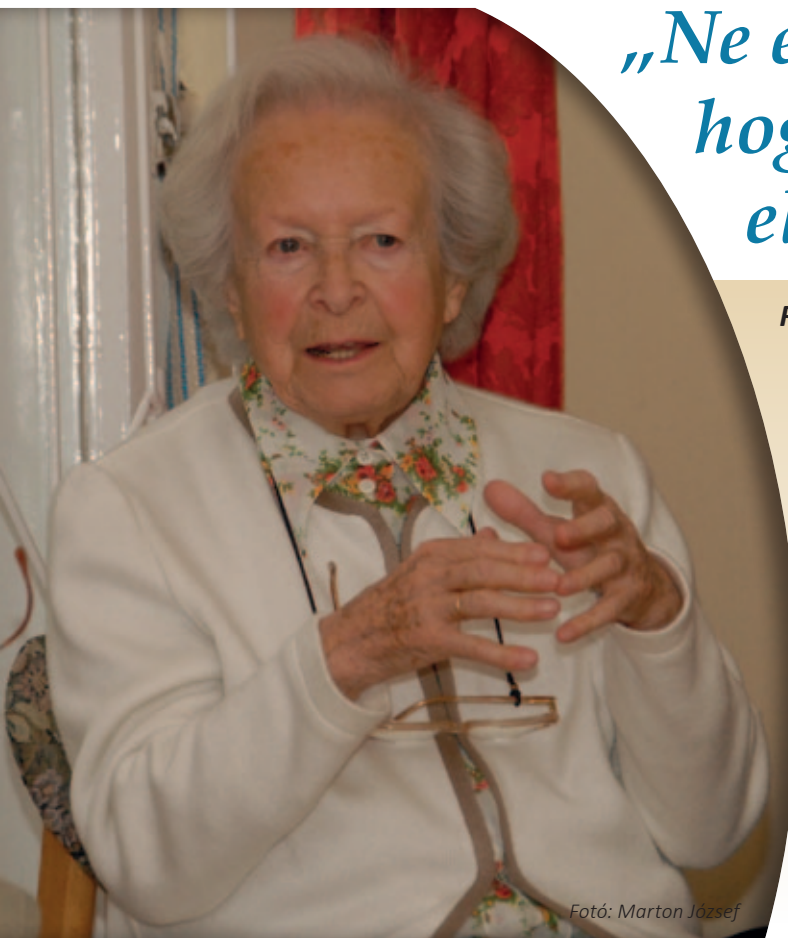
Fotó: Marton József