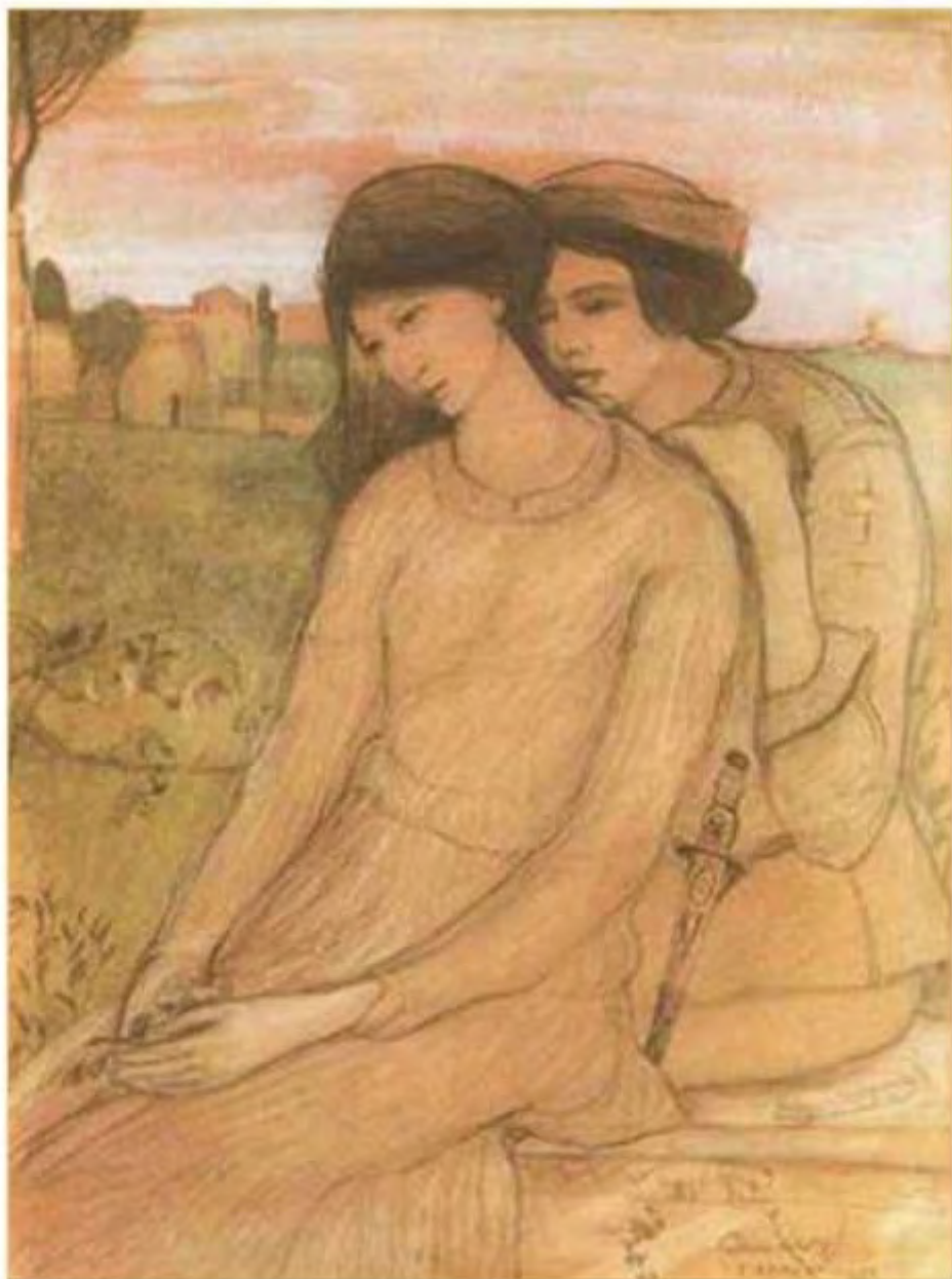
Gulácsy Lajos (1882–1932): Paolo és Francesca