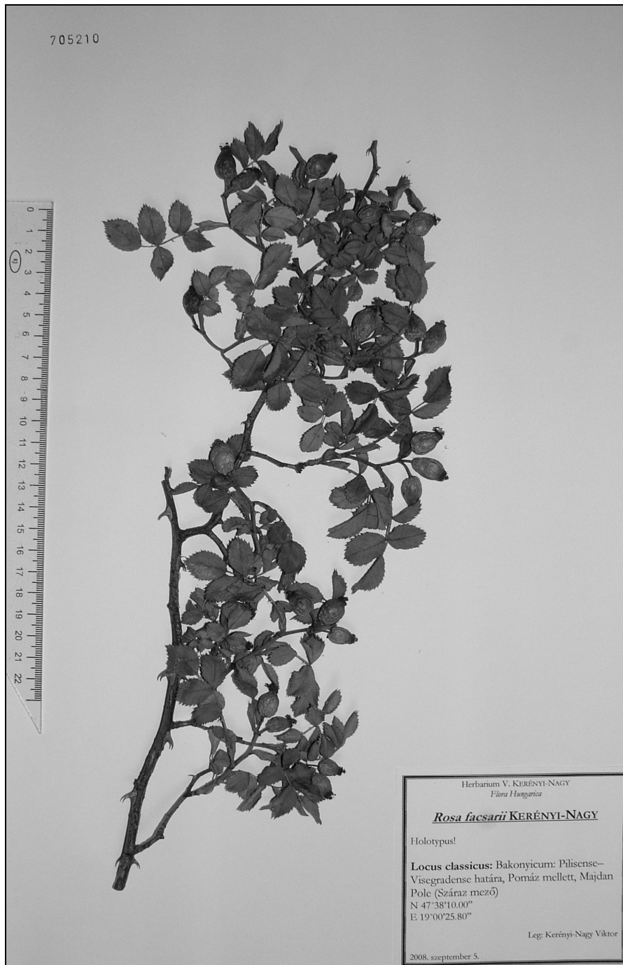
2. ábra – Rosa facsarii KERÉNYI-NAGY (Holotypus in Budapest)