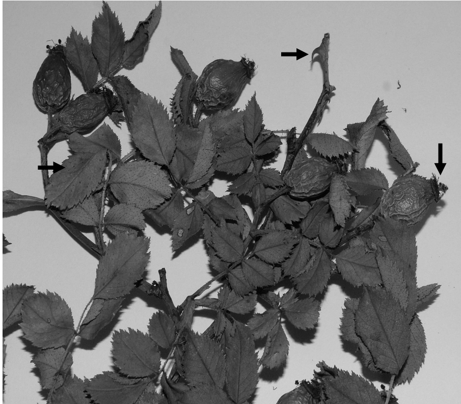
3. ábra – Rosa facsarii KERÉNYI-NAGY (Holotypus in Budapest)