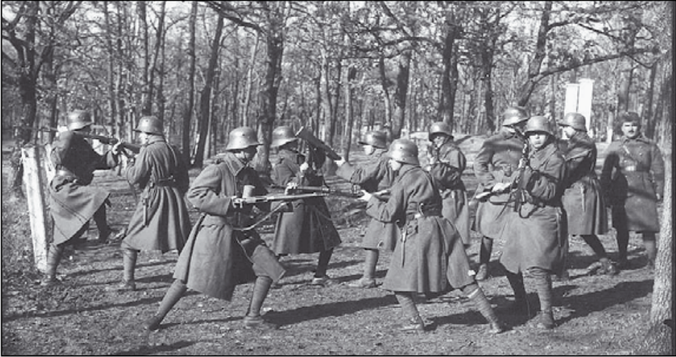
2. kép. Közelharc-kiképzés.