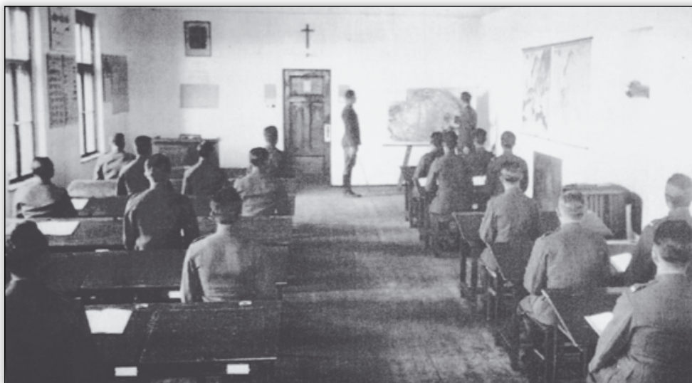
1. kép. Elméleti tantárgy oktatása

Az elméleti vizsga a következőkből állt: