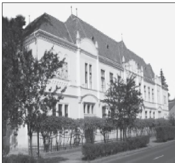
3. kép. Az iskola mai épülete

Az iskolai értesítők is sugallják, hogy az oktatáspolitikai fejlődésével, az 1920-as évektől életbe lépő újabb és újabb oktatási rendeletekkel az iskolai oktatás mellett a tanulók nevelése is egyre nagyobb hangsúlyt kapott, ezáltal érezhető a fokozatos átalakulás, fejlődés a tanítás és nevelés módszertanában. A nevelési feladatokba a '20-as évek közepétől a szülőket is aktívan bevonták (1921-től lett kötelező a szülői értekezletek megtartása), s a '40-es évekre megjelent az értesítőkből az otthon történő faültetés és a madáretetés is. Természetismereti, természetvédelmi szempontból ezt a nevelési feladatot az iskolákban a Madarak és Fák Napjának rendszeres ünneplése és a további évközi programok, kirándulások szervezése hatékonyan szolgálta.