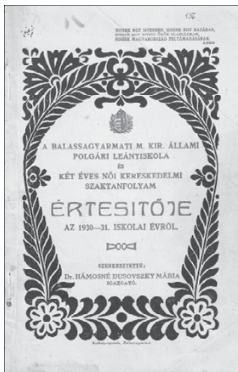
1. kép. Iskolai értesítő palóc díszítő motívumokkal az 1930/31-es tanévből

A balassagyarmati Kiss Árpád Általános Iskola ( a továbbiakban: KÁÁI ) az idén ünnepli fennállásának 140. évfordulóját, amely a jelenlegi általános iskolák közül a legrégebbi múlttal rendelkező a városban. Időtállósága a kezdetektől máig is tartó színvonalas oktatás és a gyerekek sokrétű érdeklődési területeinek kielégítését célzó tevékenységek (különbéféle szakkörök, sportélet, kulturális programok) eredménye.