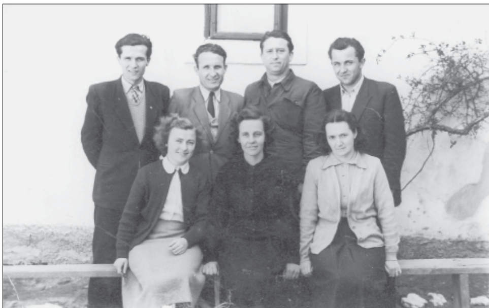
2. ábra. A tantestület az 1952-53. tanévben