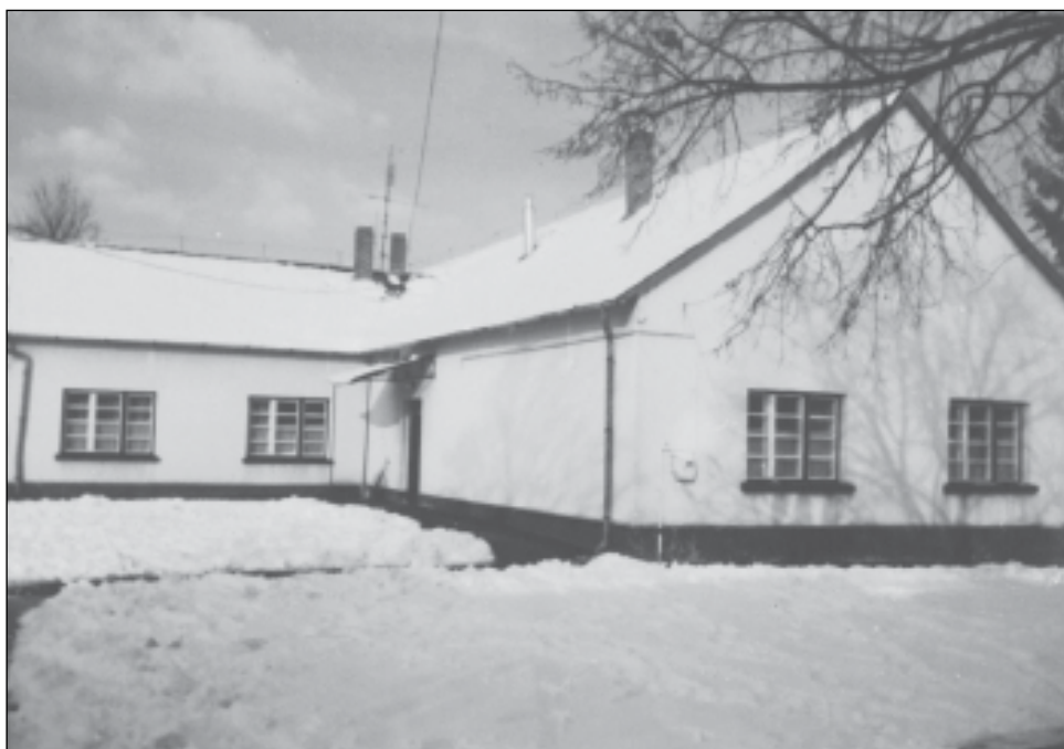
5. ábra. Az istállóból kialakított iskolaépület