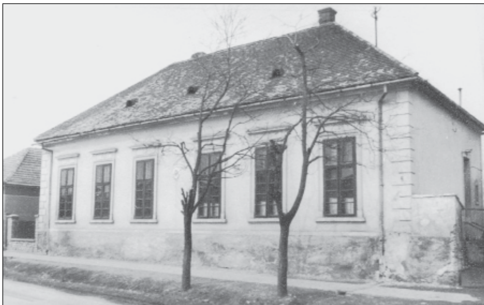
3. ábra. Állami Általános Iskola, 1948

A nyirádi Római Katolikus Elemi Népiskolát 1948. június 15-én államosították. A Dózsa utcai iskola épületében található három tanterem mellé a pajta és az istálló helyén kialakítottak egy negyedik tantermet is.