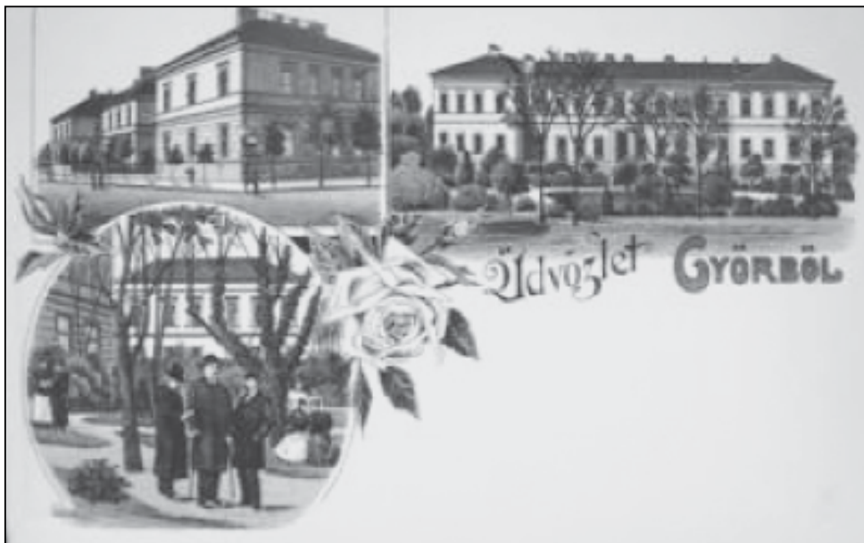
Az állami tanítónőképző és internátusa 1884-ben elkészült épületei és kertrészlete korabeli képeslapon

Az alábbiakban azt kívánom bemutatni, hogy a háború hogyan, miképpen változtatta meg a Nyugat-magyarországi Egyetem Apáczai Csere János Kar elődintézményei egyikének, az 1875. október 20-án Győrben megnyílt Magyar Királyi Állami Elemi Népiskolai Tanítónőképző Intézetnek mindennapjait. Korabeli győri sajtóhírek, iskolai értesítők, valamint a fennmaradt irattári dokumentumok adatainak felhasználásával egykieszem szemléltetni a tanítónőképző tanárainak és növendékeinek hősöket segítő akcióit.