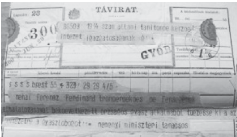
Az állami tanítónőképzőnek küldött távirat a gyászlobogó kitűzéséről