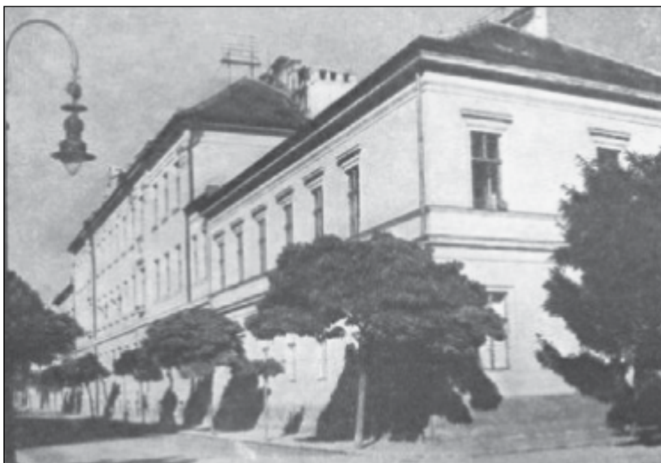
Az állami tanítónőképző 1913-ban készült új épületszárnya

A tanítónőképző nemzetemelő munkájának feltételei kezdetben szerények voltak, az eredetileg nem oktatási célra készült, viszonylag rossz állapotú épületekben kezdtek meg tanulmányaikat a tanítónőjelöltek. A képzős évfolyamok számának növekedése és a kedvezőtlen épületadottságok miatt 1883-tól hozzákezdtek egy internátussal egybekötött, s oktatási célra tervezett épületek felépítéséhez, melyet 1884. október 15-én adtak át.. Csupán a testgyakorlatok helyzete nem volt még megoldott, de 1902-ben az intézet kertjében már külön tornahelyiséget is kialakítottak.