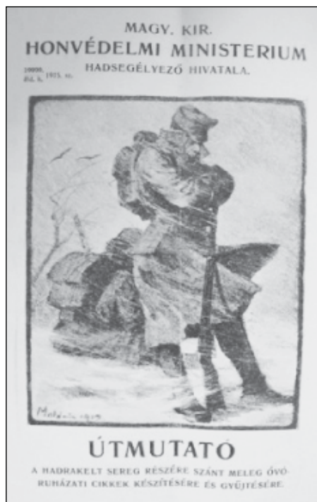
A meleg, óvó rubázati cikkek készítéséhez küldött központi útmutató címlapja

szükségünk van [...] a bósapkák, érmelegítők, térdvédők készítéséhez pamutra. [...] Szívesen vesszük az ingekhez, baskötőkhez, lábravalókhoz és téli kapcákhoz szükséges flanellt és barchetet is. Hasonló kérelmet intéztek városunk jótékony egyesületeinek igen tisztelt vezetőihez is. [...] Nemkülönben szól kérelmem egyes jótevőkhez is, kik katonáink részére a harctérre meleg rubát adományozni szándékoznak [...]. 20