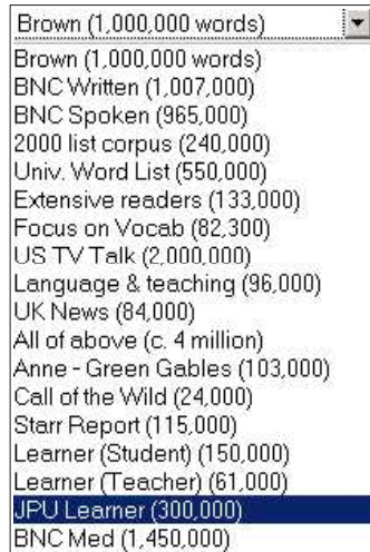
4. ábra. Az online konkordancia korpuszlistája

A BNC százmillió szóból áll. Ezeket a szavakat a gyakoriság alapján ezresével csoportosítja a profilkészítő, mely a feltöltött szöveg szavainak gyakoriságát összeveti a BNC ezres csoportjaiéval. A Graham Greene írásait elemző bekezdés szavaira az 1. táblázatban közölt gyakorisági statisztikát kapjuk.