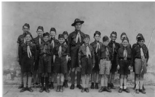
2. kép: Ámosz kiscserkészcsapat (1938)