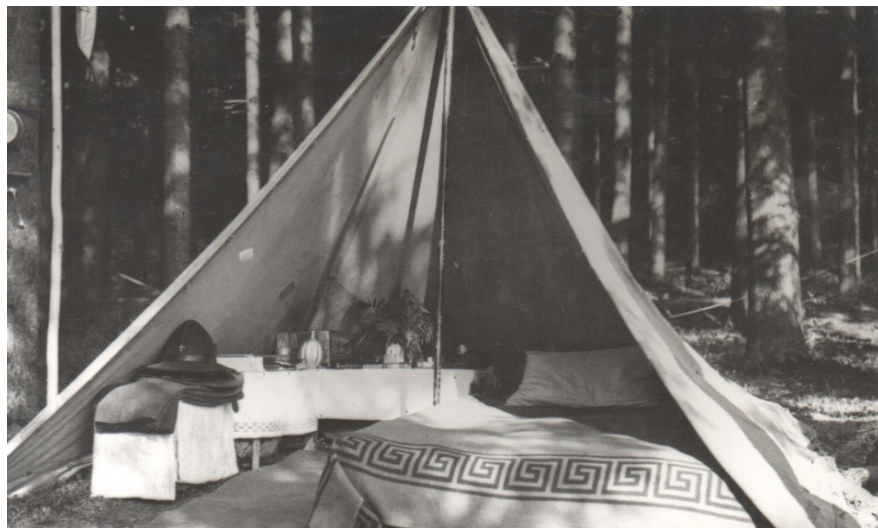
Cserkészszátor a Bükkben, 1939.