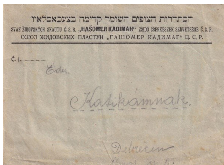
Kadima postai boríték. (Közli: Jakab 2020, 179.)

meghatott hangon. A Himnusz énekeltek ezután el, majd a cserkészcsoportok díszmenetben vonultak el a közönség előtt”. 20