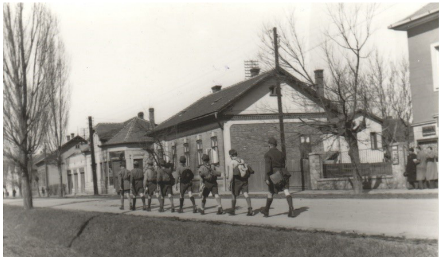
Miskolci cserkészek 1939-ben.