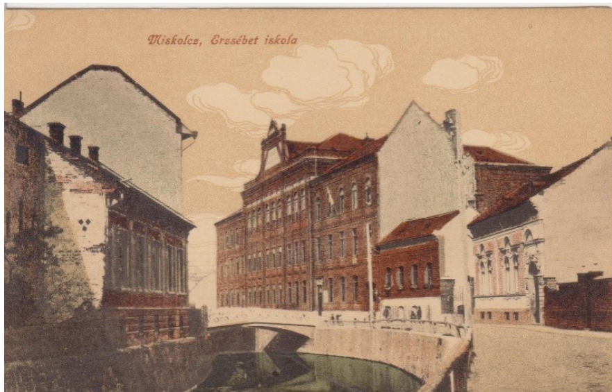
Az iskolaépület ma is áll a miskolci Kandia utcában, adóhivatal működik falai közt. (Képeslap, HOM HTD 73.474.1.26.)