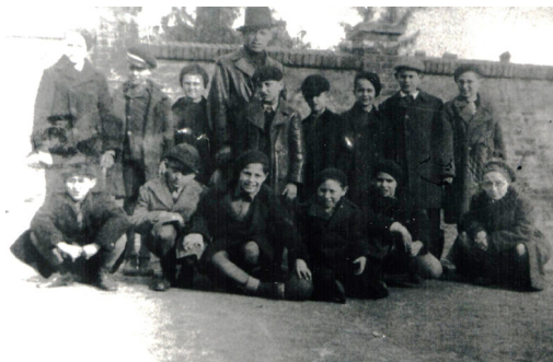
1. kép: Pécsi izraelita kiscserkészek (1936)

Az engedélyt 1937. június 25-én adta ki az Intéző Bizottság, az iskola 1936. július 3-án kelt újabb kérvényét követően, amely csupán november 6-án ment el a VI-VII. kerület titkárságából a Cserkészszövetség központjába. Mivel 1936-tól kezdve magyarországi zsidó cserkészcsapatok számára ótestamentumi névválasztást engedélyezett a cserkészszövetség (ez indokolhatja a második kérvény szükségességét), a csapat utóbb Ámosz próféta nevét vette fel, a csapatbélyegző tanúsága szerint 1937-ben. 11