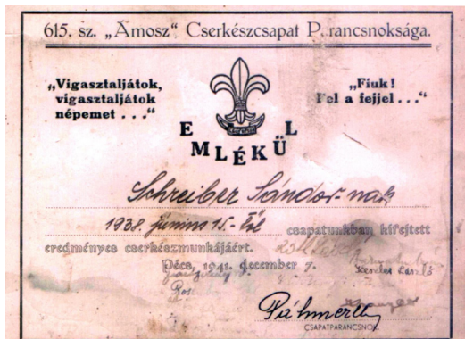
5. kép: Emléklap (1941)