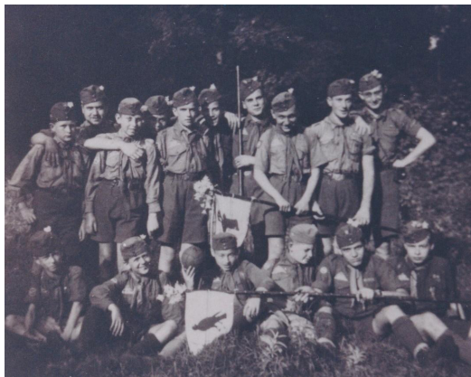
4. kép: A Zerge és a Sólyom ős kiránduláson (1940)