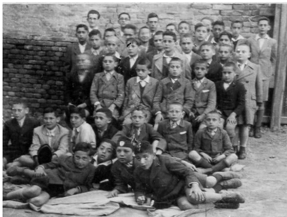
3. kép: A cserkészcsapat nagy része illegálításban 1940 után

„Az 1941. december hó 16. napján megküldött jelentésemben foglaltak kiegészítésképpen van szerencsém közölni, hogy a Szegedi Izr. Hitközség által fenntartott és a 3129/1941. sz. véghatározattal feloszlattott 598. sz. Báró Jósika Miklós cserkészcsapat használatában volt és a Hitközség tulajdonát képező vagyontárgyakat illetően a Szervező Testület, – tekintettel arra, hogy ezen vagyontárgyak a múltban is az egyetemes szegedi zsidó ifjúság céljait szolgálták és a cserkészcsapaton kívül a Hitközség egyéb ifjúsági egyesületei is használták, – akként intézkedett,