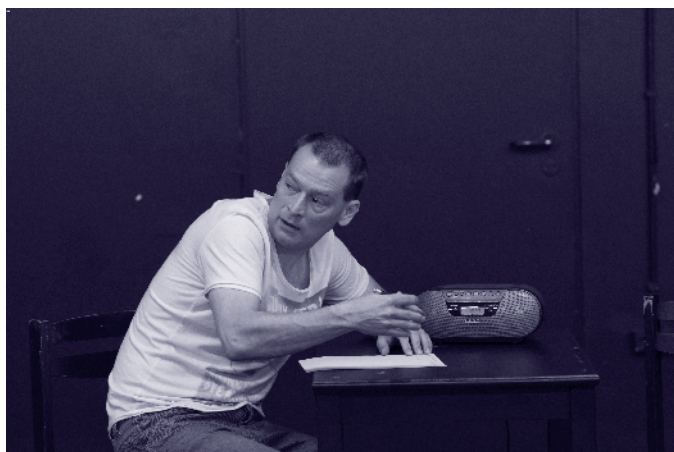
Üres lap 1.

Az elmélet és a gyakorlat összhangja az élet minden területén elvárt. Olyan ágazatokban, mint a köznevelés, szinte kötelező. Intézményi szinten mi erre törekszünk. Meg vagyok győződve arról, hogy a feladatot eredményesen meg tudjuk oldani, és diákjainkat a tőlünk telhető legjobb és leghatékonyabb nevelés-oktatással juttatjuk el reális céljaikhoz. Mindehhez adott egy komótosan úszó Noé bárkája.