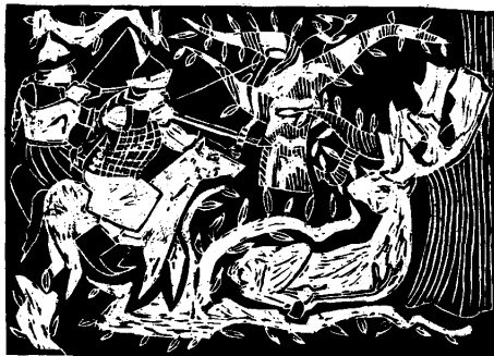
Horváth Szabolcs, Budapest