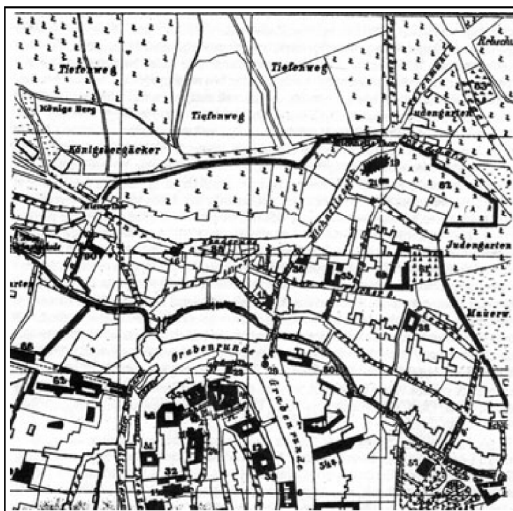
Részlet Sopron 1886. évi térképéből