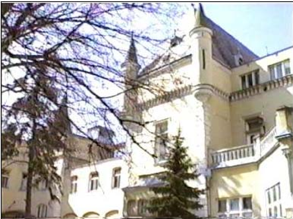
A Törley kastély

a könyvtár. 4 A másik intézmény és könyvtár az Országos Röntgen és Sugárfizikai Intézet (ORSI). Az Országos Társadalombiztosító Intézet (OTI) 1930-ban hozta létre az Országos Sugárfizikai Laboratóriumot (OSL). Feladata a röntgenlaboratóriumok szakmai, szervezési és sugárvédelmi kérdései voltak. 1956-tól – az átszervezést követően – működött ORSI néven 2005. január 31-ig, amikor az Egészségügyi Minisztérium megszüntette. Három munkatársat, a megmaradt műszereket, bútorokat, számítógépeket, könyveket az OSSKI vette át. Tavaly januárban a IV. kerületi Baross utcai fűtetlen, világítás nélküli épületrészben fagyos újjakkal válogattam a dexion salgo állványon porosodó hiányos állomány között.