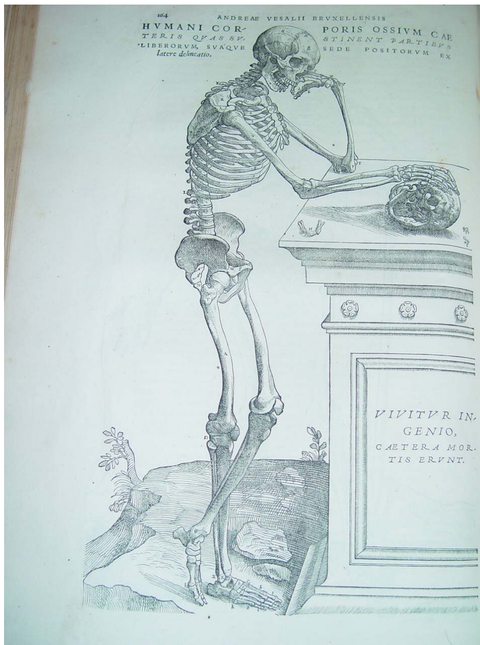
További részlet Vesalius anatómiai atlaszából