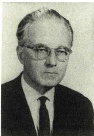
BÓNIS GYÖRGY (1914—1985)

Nemrégiben távozott az élők sorából az a tudós jogtörténész, akinek könyvei, tanulmányai nélkülözhetetlenek a szakembereknek, mindamellet érdekese és izgalmas olvasmányokat jelentenek a múlt történései iránt érdeklődők számára.