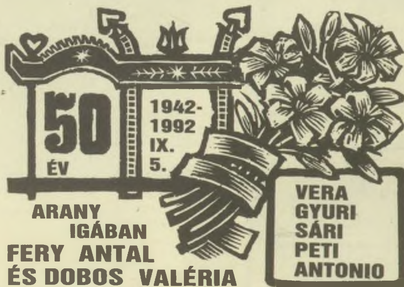
Fery Antal fametszetei (X2)