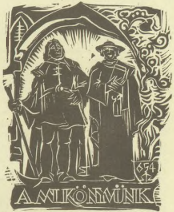
Szilágyi Imre linómetszetei (X3)

ében a debreceni Déri Múzeum, a Hortobágyot ábrázoló képzőművészeti alkotásokból, fényképekből. A kiállításon több grafikusművészünk alkotása is szerepelt, ezért az eseményről való megemlékezés lapunk „profiljába” is beletartozik.