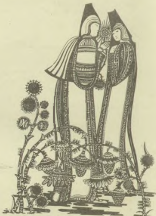
Lajos Ferenc rajzai (P1)