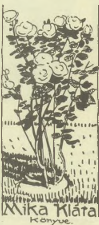
Mika Klára Könyve.

rája. Van Gogh művészetének nyilván egyik legodaadóbb hazai kutatója, dr. Soós Imre a művész Csillagos ég című tollrajzának a kalandos történetét kíséri végig. Van Gogh a rajzot a hasonló című, jól ismert festménye elkészülése után készítette az öccse számára, ám mindaddig azt hitték róla, hogy a brémai múzeum sok egyéb műkincsével együtt a világháború alatt ez is elpusztult. Az 1990-es években azonban kiderült, hogy egy szovjet tiszt a háború végén több száz rajzot talált egy németországi pincében, s azt a holmijába rejtve megmentette a „köz” javára. Valóban a köz javára, mert amikor az Orosz Építészettörténeti Múzeum igazgatójává nevezték ki, akkor az egész gyűjteményt – köztük a Van Gogh rajzot is – ott helyezte el. Cikke végén – ha némi iróniával is – dr. Soós sem tagadja a „becsületes megtaláló” érdemeit, de joggal teszi fel a kérdést, hogy vajon mikor fognak majd visszakérülni a rajzok az eredeti tulajdonoshoz, a brémai múzeumba.