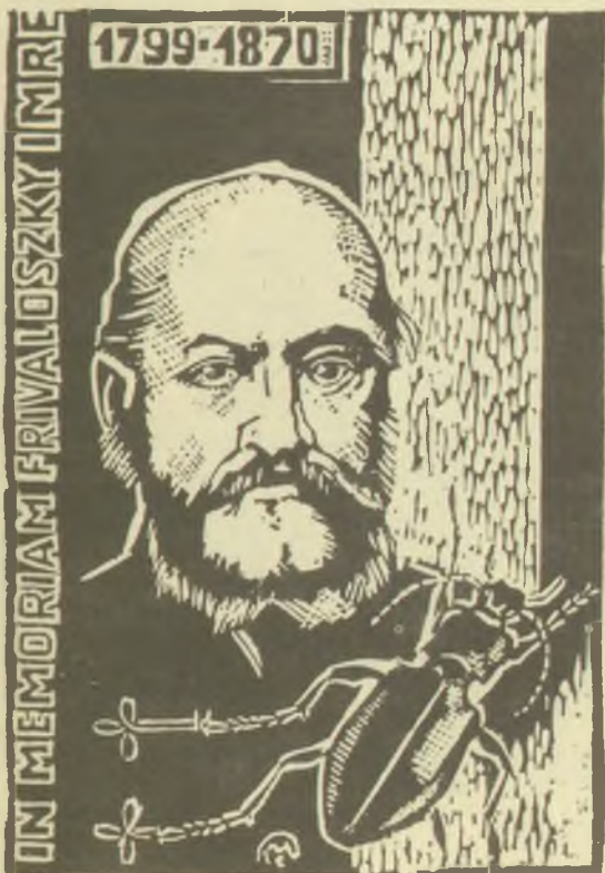
Csiby Mihály linómetszetei (X3)