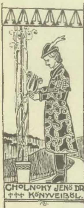
CHOLNOKY JENŐ DR KÖNYVEIBŐL.