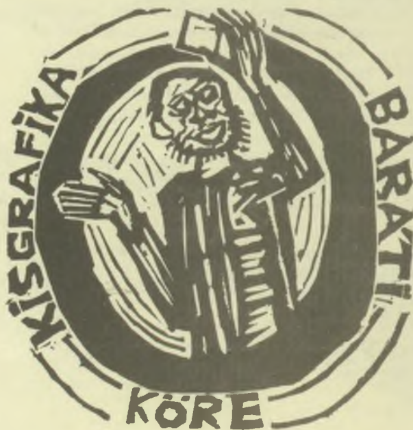
Perei Zoltán fametszetei (X1)