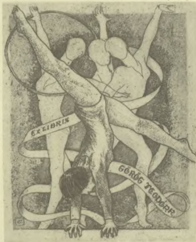
Bagarus Zoltán rézkarca (C3)

A kis kötet igen ízléses kiállításban, jó nyomdatechnikával készült. A grafikákat sárga alányomással, fekete színben reprodukálták, ami igen előnyös bemu-