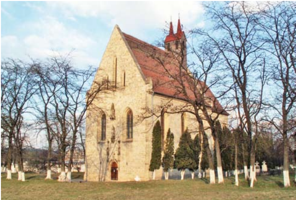
A kolozsmonostori apátsági templom napjainkban