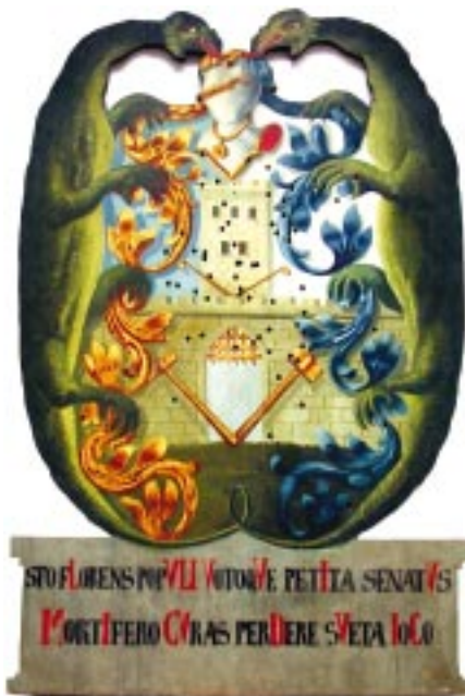
2. kép: A címer az 1934-es céltáblán