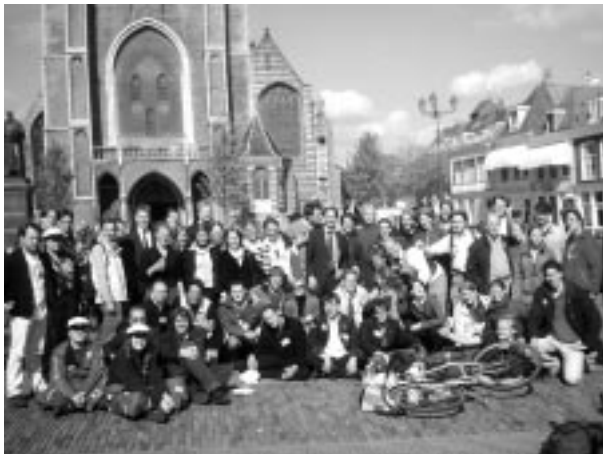
A diákhét résztvevői Delft főterén

A rendezvény programjának gazdagsága és szervezésének magas szintje meglepetésként ért minket. Hétfőn a várost néztük meg lovas kocsival, kedden a Corus kohászati üzembe látogattunk el. A Corus a világ egyik legnagyobb acél- és alumínium fémtermékek gyártásával és forgalmazásával foglalkozó vállalata, amely ugyanakkor tervezéssel, technológiafejlesztéssel és szaktanácsadással is foglalkozik.