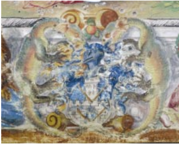
1. kép: Selmecebánya címere a jogkönyvben