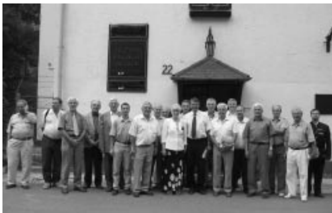
A koordinációs szervezet alapítói

A Területi Szervezet folyamatos és eredményes működése érdekében koordinációs bizottságot hoz létre, melyben részt vesznek a Miskolcon működő, és a társulásban résztvevő bányász, kohász szervezetek képviselői.