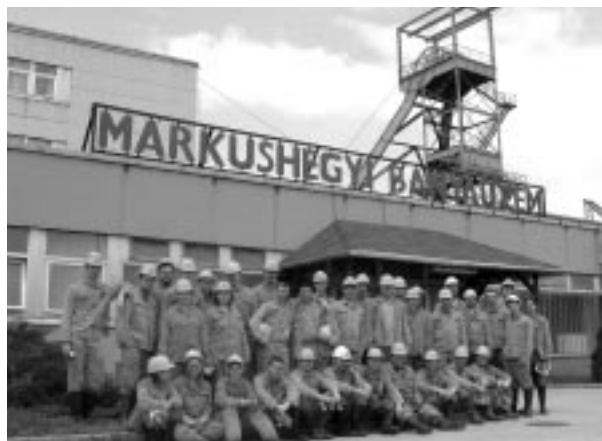
A bányajárás után

A program könnyed zárásaként látogatást tettünk az Oroszlányi Bányászati Múzeumban, ami a volt XX. akna környezetében épült ki, és méltó emléket állít az itt és a környéken folyó több generációs bányászati tevékenységnek.