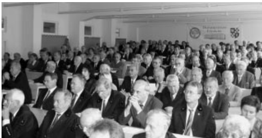
A küldöttgyűlés résztvevői

– Folytatni kell az elmúlt évek takarékoságát a gazdálkodásban. Sikeres és jó volt az ún. közös lapszám évenkénti egy-kétszeri kiadása, mert ez minden tag számára ad új információt és lehetővé teszi a másik