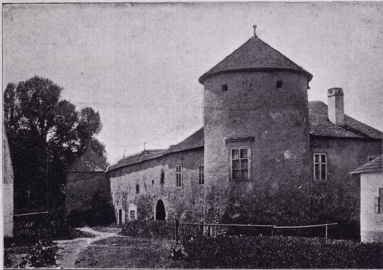
A márkusfalvi vár északkeleti tornya, melyben a családi levéltár őriztetik.