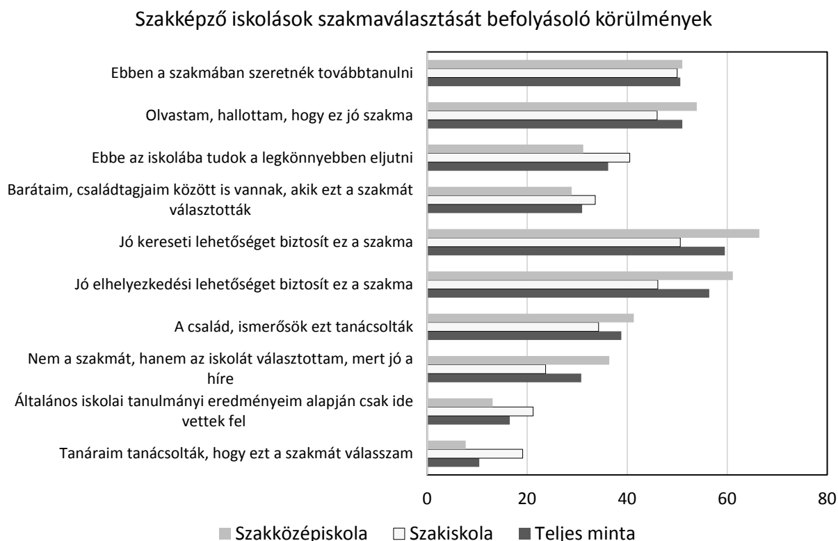
1. ábra. A szakképző iskola- és szakmaválasztás szempontjait nagymértékben jellemzőnek tartó tanulók aránya a képzés típusa szerint, Dél-Alföld Régió, 2015 (%)