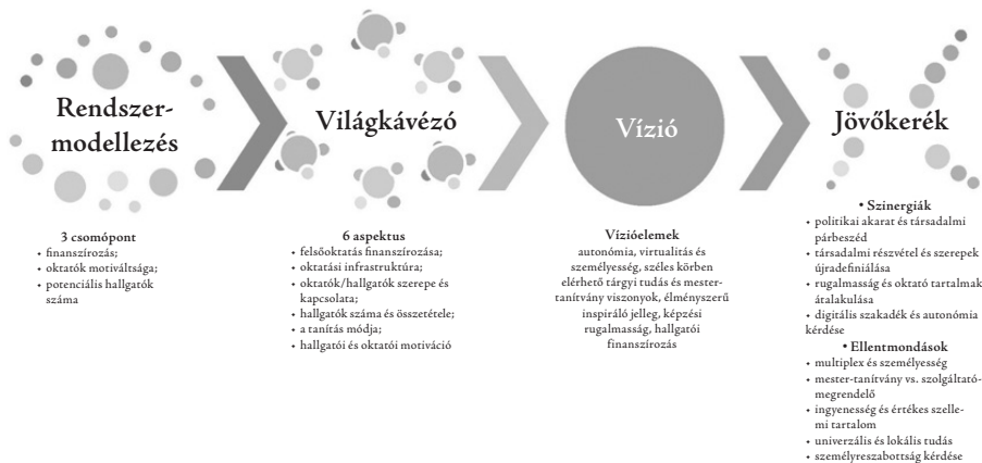
1. ábra A backcasting alprojekt egyes szakaszai során kialakult fő témák összefoglalása

Terjedelmi okok miatt nem mutatjuk be az egész folyamatot módszerenként. A következőkben csupán az oktatók által kidolgozott normatív víziót ismertetjük, mivel egyrészt véleményünk szerint ez az egyik eddig legérdekesebb eredménye kutatásunknak; másrészt pedig ez vethető, hasonlítható össze a legjobban a nemzetközi szakirodalomban fellelhető jövőképekkel.