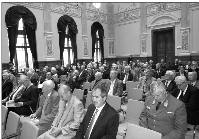
Fennállásának 25. évfordulóját ünnepelte a Magyar Hadtudományi Társaság a Nemzeti Közszerológati Egyetem Ludovika téri kampuszának dísztermében

2015. október 13-án jeles eseményre került sor Nemzeti Közszerológati Egyetem Ludovika téri kampuszának dísztermében: fennállásának 25. évfordulóját ünnepelte a Magyar Hadtudományi Társaság, amely az évforduló alkalmából tartotta jubileumi közgyűlését és szervezett tudományos konferenciát hagyományos partnereivel, az MTA Hadtudományi Bizottságával és a Nemzeti Közszerológati Egyetemmel. A tanácskozás a Napjaink hadtudománya című rendezvénysorozat láncolatába illeszkedik. A rendezvény keretében köszöntötték a Társaság még akív alapító tagjait, akiket az erre az alkalomra készített emléklappal ajándékozott meg az elnökség. A megnyitót és a köszöntések után elhangzott előadások felidéztek az elmúlt negyedszázad emlékezetes pillanatait, méltatták a hadtudomány művelése érdekében tett erőfeszítéseket, illetve körvonalazták a hadtudomány és a Társaság előtt álló kihívásokat.