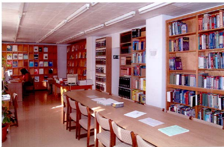
A Zala Megyei Kórház szakkönyvtárának olvasóterme