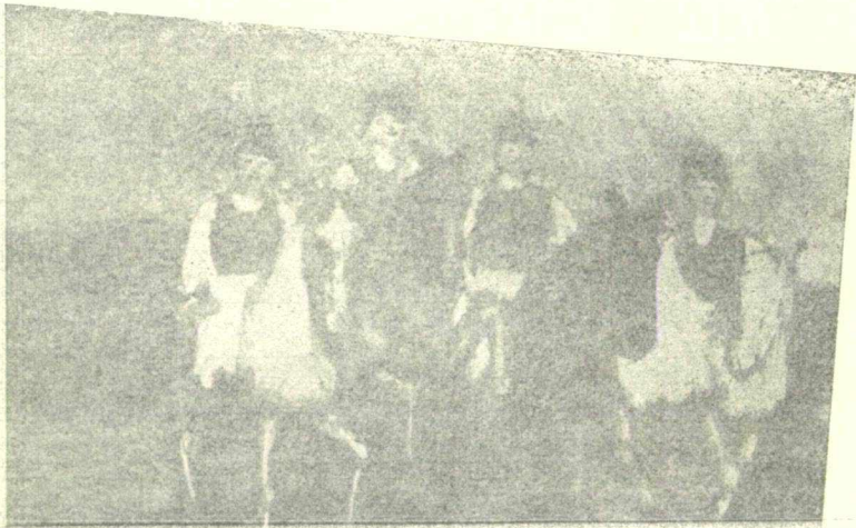
Four girls in the field Orange Jane paper