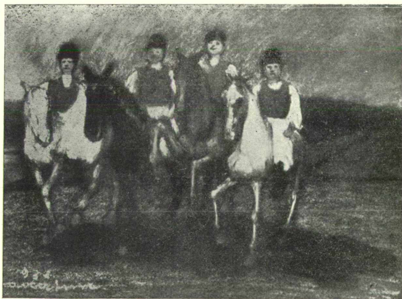
Oravecz Imre képei. Fent: Vásári kikiáltó, lent: Lovasok.